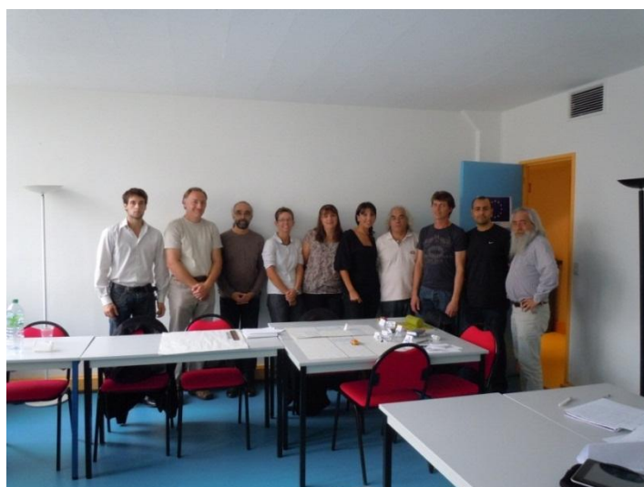
Figure 1 : le groupe de travail octobre 2011

Le choix initial de ne retenir que des enseignants de la conduite pour participer à l'élaboration des exercices n'a pas été tenu. L'expérience a montré que ce fait ne constitue en rien un frein à la production et à l'enrichissement des pratiques, la richesse du réseau FARE résidant justement dans la multiplicité des interventions proposées et des intervenants. Le CEREMH (Centre de ressources et d'innovation mobilité handicap), dans le cadre des formations qu'il dispense auprès des publics handicapés, a également envoyé un enseignant de la conduite qui, en son sein, est en charge du projet BSR (Brevet de Sécurité Routière) auprès des Etablissements et Services d'Aide par le Travail (ESAT) ainsi qu'un ergothérapeute. Deux autres enseignants d'écoles de conduite associatives intervenant auprès de publics handicapés ont participé aux groupes de travail alors qu'une structure a fait participer son chef de projet et de développement.