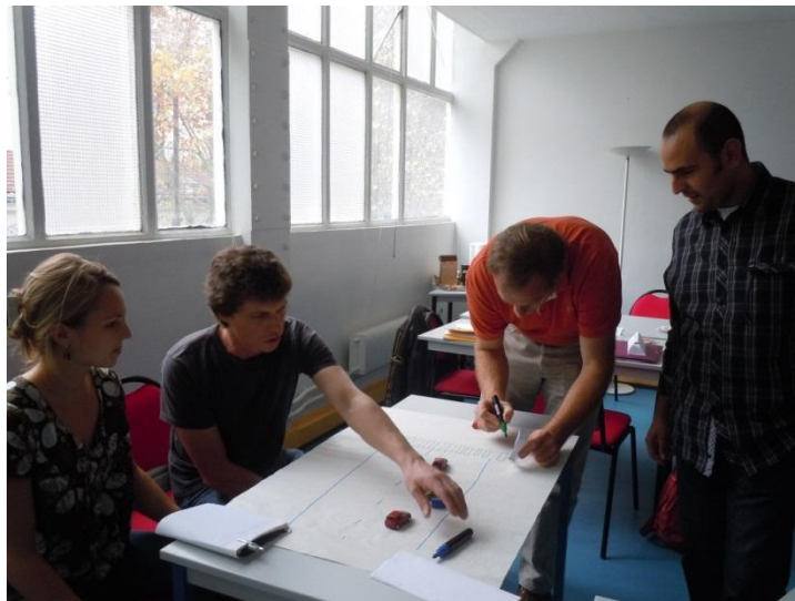
Figure 4 : travail au sein d'un groupe

Les moments de restitution permettaient de discuter de l'avancement des exercices et de les faire évoluer à partir des remarques de l'ensemble des participants.