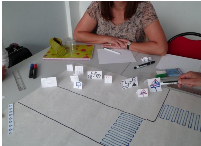
Figure 2 : travail pour des élèves en grande difficulté