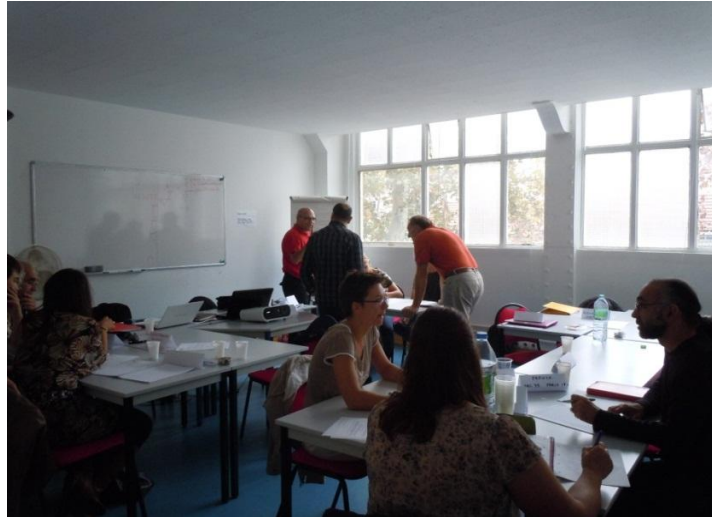
Figure 3 : la répartition du travail en groupe