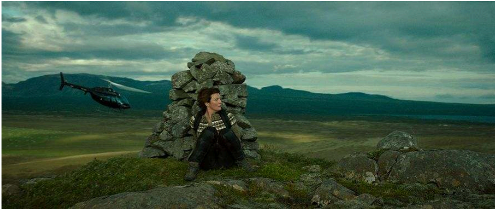
Illustration2 : Photogramme du film Woman at war . Benedikt Erlingsson (réalisateur). 2018. Sena, Jour2fête. [DVD]