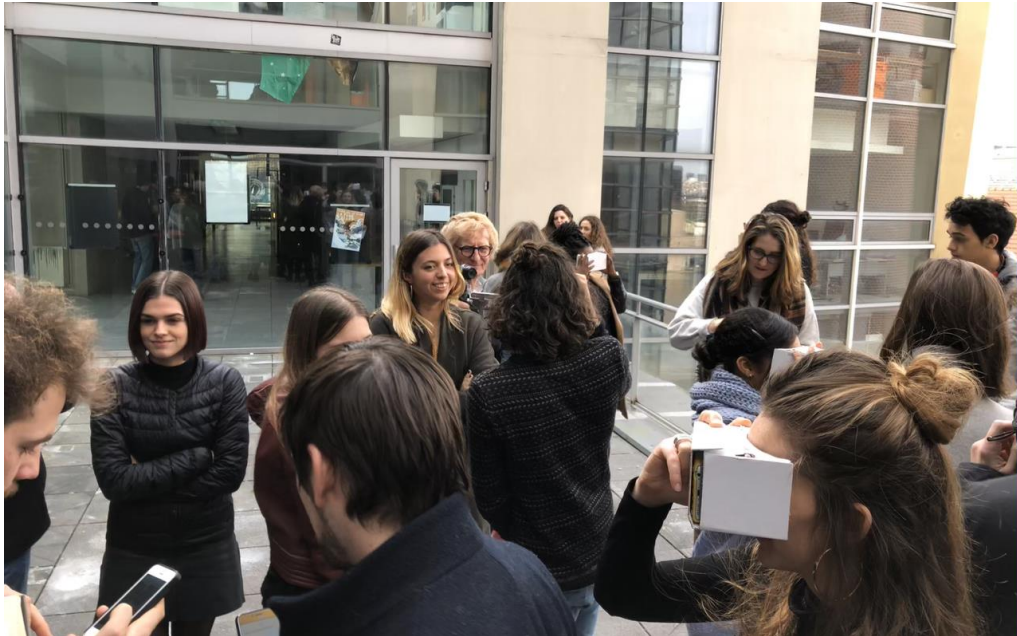
Visite collective virtuelle des espaces proposés par les étudiants