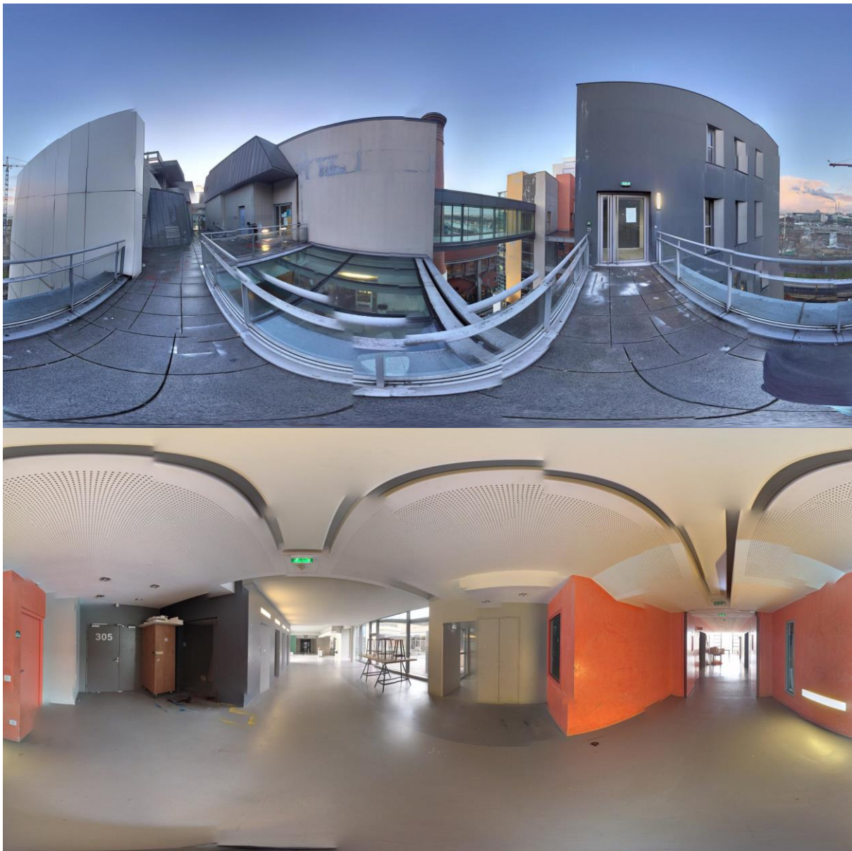
Vues 360 degrés des espaces choisi par les étudiants dans l'école