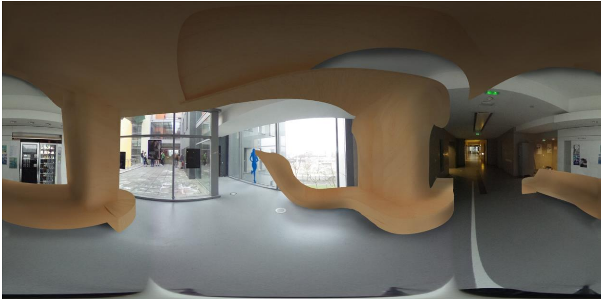
Projet de banc-plafond proposé par un groupe d'étudiants