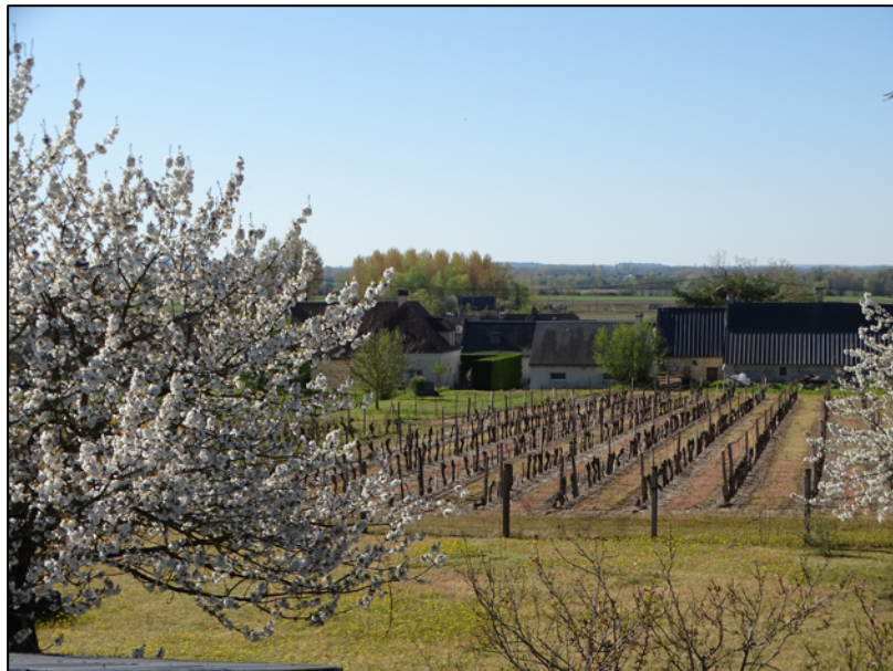
Cliché : A. Robert, 05/04/2020