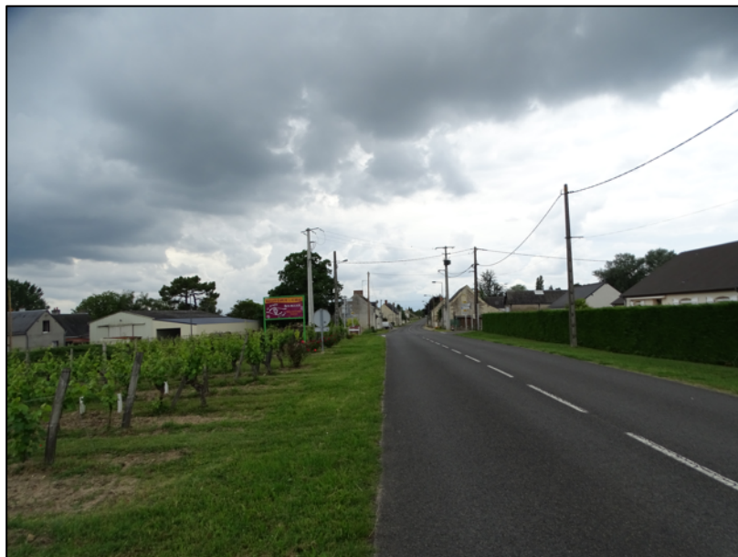
Figure 2 : La route départementale, reliant Restigné à Bourgueil, bordée d'habitations et de vignes