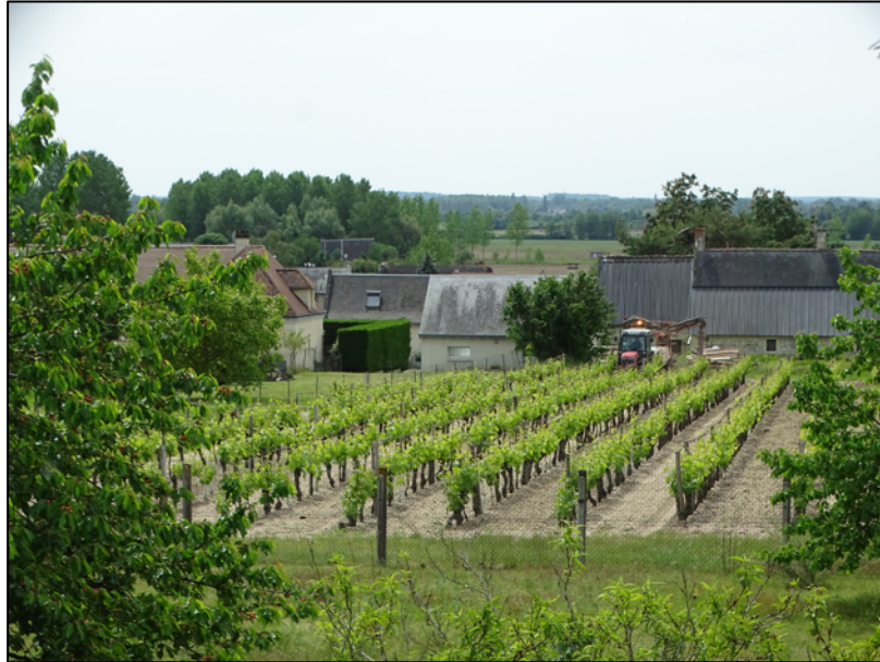
Cliché : A. Robert, 07/05/2020

Ces paysages du quotidien s'appréhendent aussi par les autres sens, dont l'ouïe. Mais force est de constater que, dans cette campagne paisible du Val de Loire, le confinement n'apporte que peu de changements. Certes, la route départementale n'est guère empruntée (fig. 2) mais elle ne l'est pas beaucoup plus en temps normal, hormis aux heures d'embauche et de débauche. Les bruits des tracteurs sont, eux, toujours perceptibles car, malgré le confinement, les travaux dans les vignes doivent se poursuivre : les pluies imposent aux viticulteurs de traiter (fig. 4), pour éviter le développement des champignons et des maladies en conséquence comme le mildiou. Précisons que cela vaut aussi, même plus encore, pour ceux convertis à l'agriculture biologique. Des zones de non-traitement ont été définies par arrêté en décembre 2019 mais le confinement aurait été l'occasion d'en réduire les distances aux habitations :