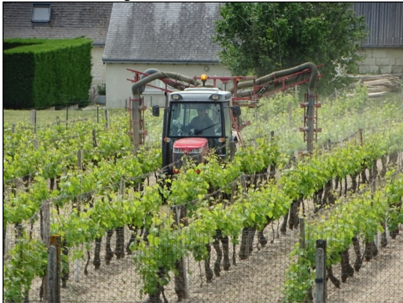
Figure 4 : Viticulteur traitant la vigne voisine

Cette expérience vécue du confinement dévoile une portion de paysages du Val de Loire bien restreinte mais elle nous amène aussi à réfléchir plus largement aux paysages du quotidien et à faire ainsi un détour épistémologique, vers les paysages vécus et représentés.