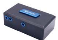
Module de conversion de fréquence