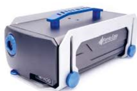
FROG mono-coup et multi-coup