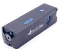
Autocorrélateur mono-coup et multi-coup