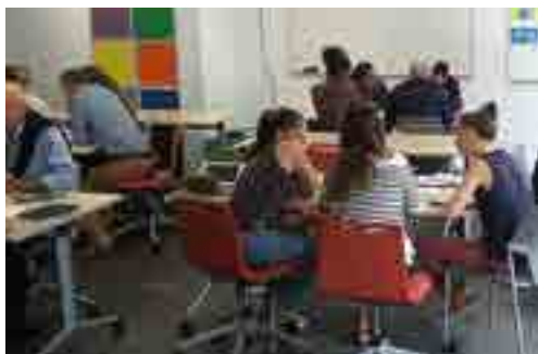
Travail en atelier par thématique