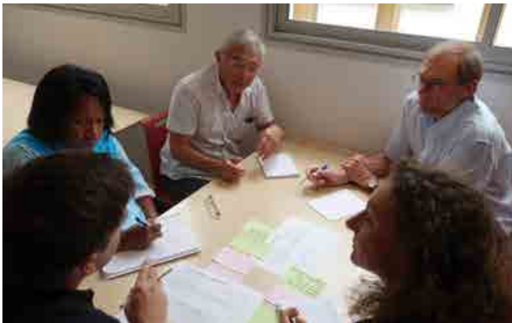
Atelier « Eau et gouvernance »

Depuis plus d'une vingtaine d'années, les recherches et les études sur l'eau se sont centrées sur l'amélioration de la connaissance de la ressource en eau douce, tant d'un point de vue quantitatif que qualitatif. Pour autant, peu de recherches portent sur les enjeux et les modes de gouvernance de cette ressource. Travailler sur la gouvernance de l'eau en Nouvelle-Calédonie semble d'autant plus nécessaire que cette dernière connaît une répartition des compétences complexe et originale, à travers ses différentes institutions, articulée à une réglementation encore en cours de construction et pas totalement adaptée aux pratiques des Calédoniens. De plus, l'organisation institutionnelle diffère en fonction du statut foncier des terres, les terres coutumières étant notamment exclues du domaine fluvial de la Nouvelle-Calédonie.