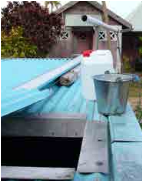
Dispositif de récupération de l'eau de pluie à Tiga

L'axe 5 renvoie à la participation de la population à la gouvernance de l'eau et à la construction des politiques de l'eau. Face aux difficultés rencontrées par les gestionnaires pour diffuser les pratiques économes en eau mais aussi aux divers blocages récurrents, le partage des connaissances, des représentations et valeurs liées à l'eau est nécessaire. En effet, les décalages et discordances parfois brutales opposants gestionnaires et usagers méritent un détour par la recherche afin de mieux comprendre les différents points de vue et d'identifier les points de blocages. Ce travail de formalisation des valeurs de l'eau peut être fait, d'une part, grâce à une recherche visant à produire des connaissances sur les valeurs diverses accordées à l'eau sur l'ensemble du territoire calédonien, tant auprès des citoyens qu'auprès des acteurs des institutions et, d'autre part, par des approches d'ordre méthodologique, qui permettraient d'adapter les processus participatifs à la population