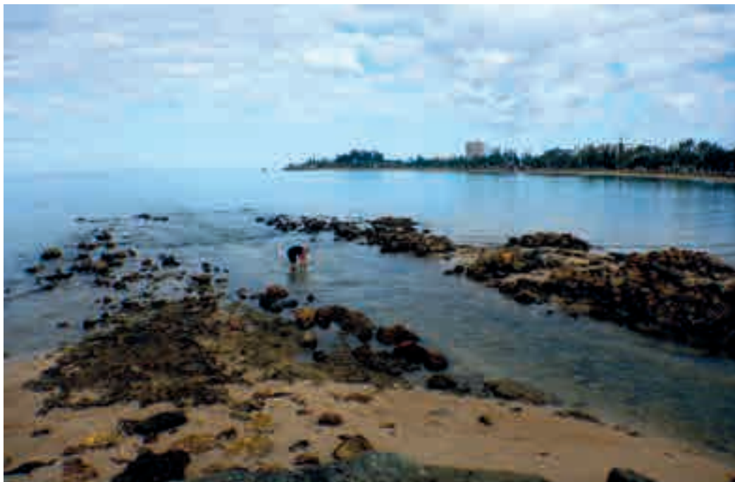
Rejet dans le milieu naturel des eaux de la STEP de l'Hippodrome, à Nouméa

Si les polluants organiques et métalliques sont étudiés depuis longtemps dans la plupart des zones maritimes tempérées, les milieux coralliens le sont, eux, de façon plus récente et leur connaissance est encore relativement fragmentaire (Roche et al. , 2010, Shaw et al. , 2010, Bonnet et al. , 2014, Briand et al. , 2014, 2017). De plus, les polluants dits « émergents » comme, par exemple, les œstrogènes dans les eaux usées (Ternes et al. , 1999) ou les thérapeutants et produits cosmétiques (Carballa et al. , 2004, Verlicchi et al. , 2010) sembleraient, à ce jour, n'avoir jamais été étudiés en milieu tropical récifo-lagonaire. La contamination générée par ces différents polluants, potentiellement intégrés dans les écosystèmes coralliens via les réseaux trophiques, peut être directement liée à l'activité anthropique (activités agricoles pour les produits phytosanitaires, activités agricoles, exploitation minière et déforestation pour l'érosion des sols, activités urbaines pour les polluants émergents, etc.) comme elle peut également être d'origine naturelle (dissolution des roches, pour quelques contaminants métalliques, etc.).