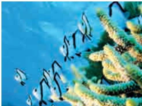
Dascyllus reticulatus , Poisson-demoiselle, Koumac

les niveaux de contamination ne semblaient pas globalement alarmants (Fey et al. , 2019). Toutefois, la contamination est bien réelle, elle varie selon les espèces et il est donc tout à fait possible de la suivre dans le temps et dans l'espace. Cette région avait été choisie car de vocation agricole et l'hypothèse était alors que divers produits phytosanitaires y étaient (ou y avaient été) utilisés. On notera que dans cette région, la configuration des bassins-versants est également « favorable » à l'érosion et donc à l'entraînement de métaux. Aucun élément de type « polluant émergent » (résidus de produits pharmaceutiques, nanoparticules, etc.) n'avait alors été recherché.