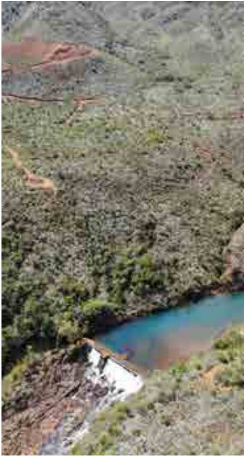
Barrage de Dumbéa