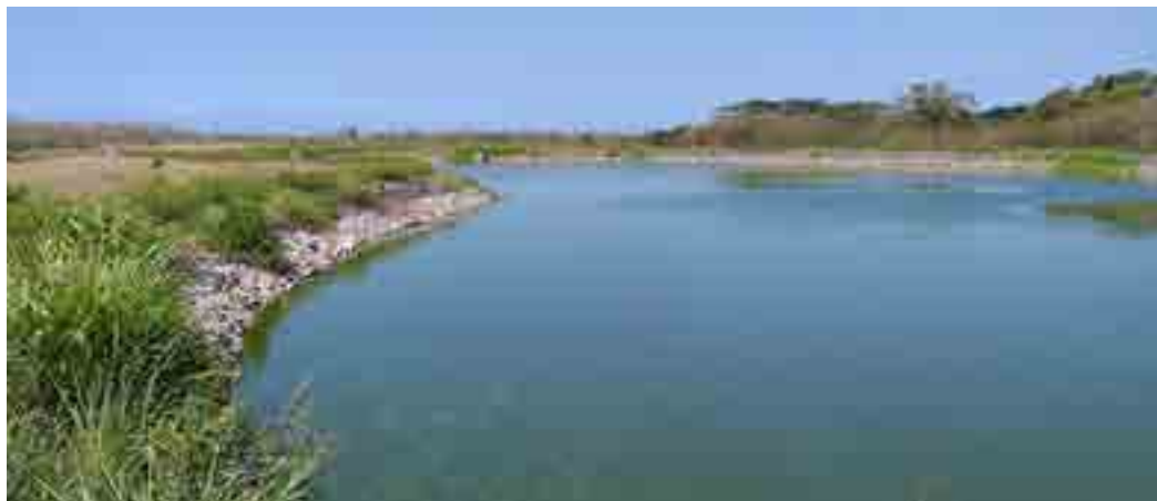
Lagunage de Koné