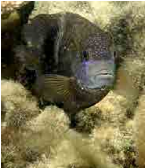
Stegastes punctatus