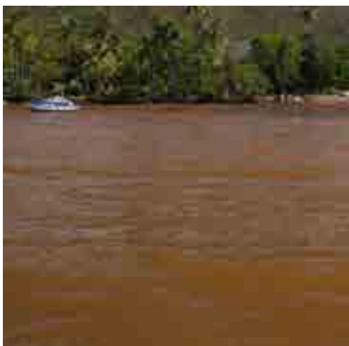
Eaux chargées de sédiments latéritiques

Le projet MECAFLOC (2018-2019) ambitionne de fournir des données concernant l'aptitude à l'agréation/floculation/sédimentation des MES transportées par les rivières sur site minier lorsqu'elles traversent la zone estuarienne qui représente l'interface entre l'eau douce et l'eau salée. Ces données sont indispensables pour envisager toute prévision de la dispersion des MES (et des métaux associés) vers le lagon. Cette capacité de prévision représente un enjeu important pour anticiper d'éventuelles pollutions du lagon suite à des événements météorologiques extrêmes et/ou des incidents industriels.