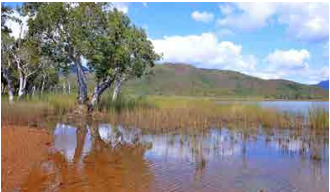
Région des lacs, sud de la Nouvelle-Calédonie

En parallèle de ces expériences, des premiers essais de modélisation des mécanismes de sédimentation des particules, réalisés à l'aide de codes couplant la simulation numérique en éléments finis (écoulement de la dispersion) et la dynamique moléculaire (interactions entre particules) (Smuts, 2015 ; Gupta, 2014), ont permis d'observer une augmentation de la vitesse du front de sédimentation avec la diminution de la concentration en particules dans le cas d'une dispersion contenant jusqu'à 30 % en volume de particules minérales.