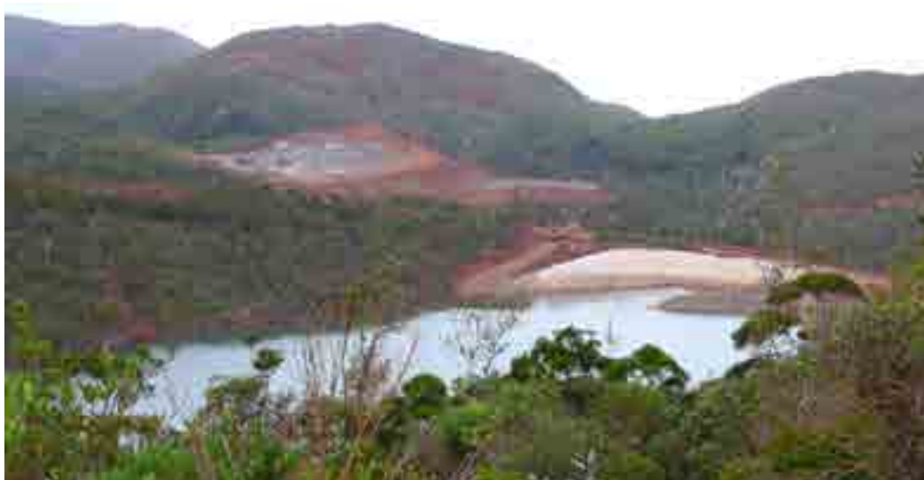
Bassin de sédimentation mis en place par Vale

Du fait des processus d'érosion et en fonction des conditions météorologiques, les rivières des massifs miniers de Nouvelle-Calédonie sont susceptibles de se charger en quantités plus ou moins élevées de Matières En Suspension (MES). Ces dernières sont principalement constituées de particules minérales qui peuvent contenir des concentrations élevées en métaux tels que le fer, le nickel, le chrome, le cobalt ou le manganèse. Les rivières participent donc à la dispersion de ces métaux qui représente un risque de pollution vers le lagon. Néanmoins, l'interface entre les rivières et le milieu marin est caractérisée par un fort gradient de salinité. Or, les MES sont susceptibles de s'agréger/floculer à travers l'eau salée puis de sédimenter. La dynamique des MES dans les milieux estuariens à l'aval des sites miniers de Nouvelle-Calédonie est donc fortement corrélée aux mécanismes d'agréation/floculation/sédimentation.