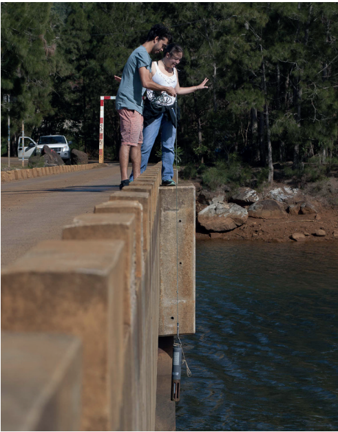
Prélèvement d'eau, rivière des Pirogues