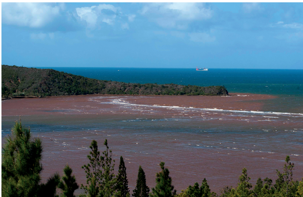
Embouchure de rivière

De par les mutations économiques, démographiques et sociétales que connaît la Nouvelle-Calédonie, des pressions anthropiques ne cessent de croître sur les milieux littoraux et côtiers. L'évaluation de l'état écologique des écosystèmes marins doit tenir compte de ces pressions, de leurs interactions, de la variabilité naturelle des écosystèmes, de leur capacité de résilience et de l'impact des changements globaux. Le projet SEARSÉ (2018-2020) propose une approche écosystémique, nécessaire à la mise en œuvre d'une Gestion Intégrée des Zones Côtières (GIZC).