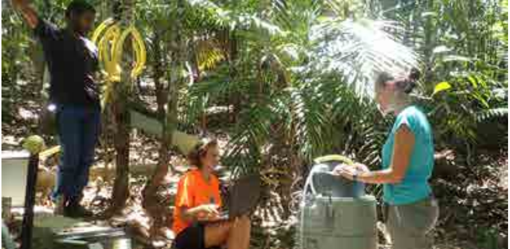
Programmation du préleveur automatique sur une des parcelles d'étude à Touho

La leptospirose est une zoonose (maladie commune à l'homme et certains animaux) d'origine bactérienne sévère de répartition mondiale. Responsable de plus d'un million de cas et près de 60 000 morts chaque année, elle affecte tout particulièrement les populations rurales d'Océanie, continent où son incidence est la plus élevée au monde. La contamination, saisonnière et liée aux fortes pluies, se fait au contact de sols ou d'eaux contaminés.