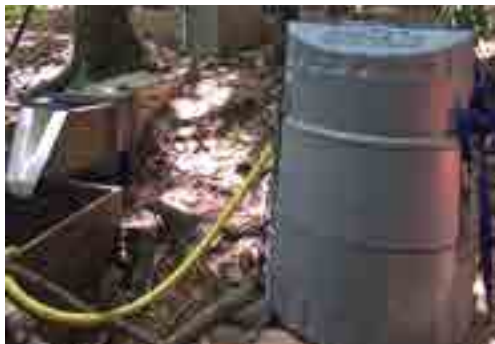
Préleveur automatique en position à la sortie d'une des parcelles d'étude à Touho

défens. L'objectif du projet est d'étudier l'hypothèse d'une persistance des leptospires dans les sols, et de leur mobilisation par les eaux de ruissellement lors des épisodes pluvieux.