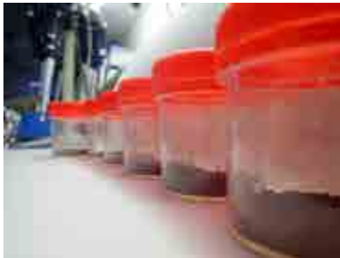
Microcosmes pour l'étude de la survie de Leptospira interrogans dans des sols

difficultés d'accès lors de fortes pluies) s'accompagne d'une baisse rapide de la concentration en leptospires. Différentes solutions sont envisagées permettant une meilleure conservation des échantillons, qui consisteraient à placer le préleveur à un endroit plus accessible ou à mettre au point une méthode permettant d'y bloquer la dégradation des ADN bactériens.