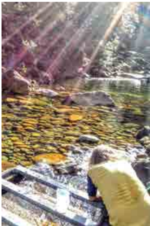
Prélèvement d'eau en vue d'analyses