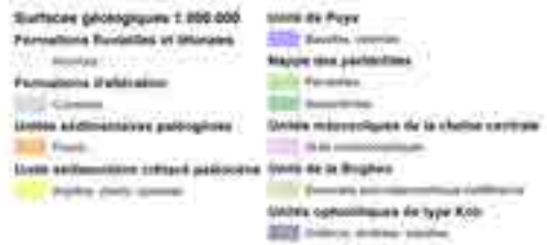
1. Carte géologique de la Nouvelle-Calédonie et des quatre secteurs d'études – 2. Commune de Houaïlou – 3. Commune de Poya – 4. Commune de Lifou – 5. Commune de l'île des Pins Les points rouges indiquent les sites de prélèvement d'eau (captages, forages) – © J. Jeanperr/DIMENC