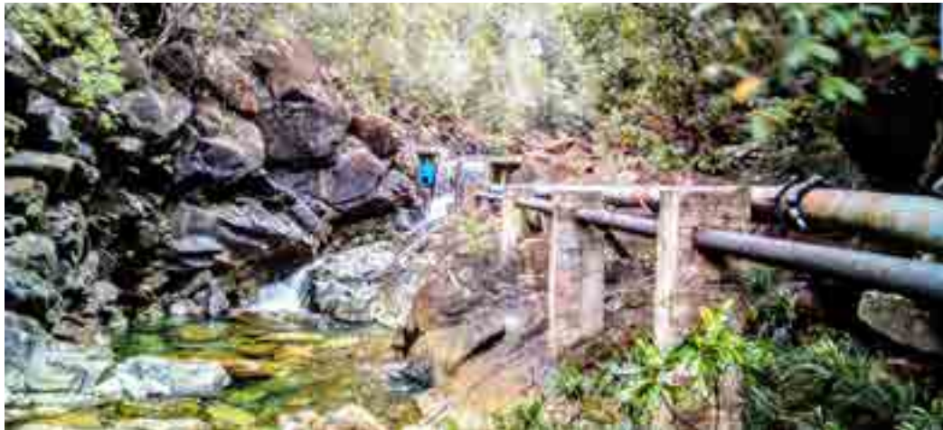
Captage d'eau de distribution

Les sols de la Nouvelle-Calédonie, développés sur un substratum ultrabasique, sont enrichis en métaux tels que le nickel (Ni) et le chrome (Cr). Les processus d'altération et d'érosion de ces sols peuvent conduire à l'augmentation des concentrations en Ni et Cr dans les eaux de surface et les aquifères (formation géologique contenant la réserve en eau), d'une part, et à engraver les cours d'eaux, d'autre part. Ni et Cr sont ainsi susceptibles d'être présents dans l'eau des creeks et des rivières, sous formes dissoutes ou particulaires et dans les aquifères, contaminant les captages d'Eau Destinée à la Consommation Humaine (EDCH) et constituant ainsi une source potentielle d'exposition. Or Ni et Cr, en particulier le Cr hexavalent (Cr-VI), sont connus pour leur toxicité chez l'homme (cancers, allergies, etc.).