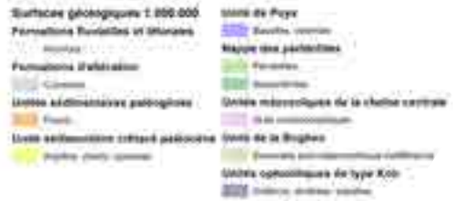
1. Carte géologique de la Nouvelle-Calédonie et des quatre secteurs d'études – 2. Commune de Houaïlou – 3. Commune de Poya – 4. Commune de Lifou – 5. Commune de l'île des Pins Les points rouges indiquent les sites de prélèvement d'eau (captages, forages)