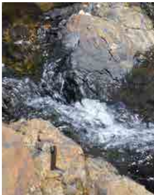
Cours d'eau, Nouvelle-Calédonie

Les résultats actuels montrent que Cr et Ni des EDCH sont surtout présents sous forme dissoute (prélèvements réalisés jusqu'alors hors période de crue). On note une forte variabilité de la proportion du Cr-VI : entre 1 et 80 % du Cr total. Le Ni dissous montre aussi une grande variabilité : entre 1 et 100 µg/L. Les échantillons prélevés sur l'île des Pins montrent les plus fortes concentrations allant jusqu'à 100 µg/L pour le Ni, Cr 42 µg/L et Cr-VI 19 µg/L, avec une relative homogénéité sur l'ensemble de la commune. Sur Houaïlou et Poya on note une variabilité des concentrations en relation avec la diversité géologique des bassins versants ; en particulier, Cr-VI < 20 µg/L avec deux points plus élevés : 39 et 56 µg/L sur Houaïlou. Les concentrations maximales sont plus faibles sur la commune de Poya, Ni : 10 µg/L et Cr : 27 µg/L. Lifou montre les concentrations les plus basses, avec les maximums Ni : 3,2 µg/L, Cr : 4,5 µg/L et Cr-VI : 3,8 µg/L.