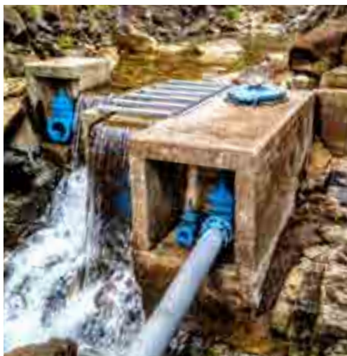
Captage d'eau de distribution

Les sols de la Nouvelle-Calédonie, développés sur un substratum ultrabasique, sont enrichis en métaux tels que le nickel (Ni) et le chrome (Cr). Les processus d'altération et d'érosion de ces sols peuvent conduire à l'augmentation des concentrations en Ni et Cr dans les eaux de surface et les aquifères (formation géologique contenant la réserve en eau), d'une part, et à engraver les cours d'eaux, d'autre part. Ni et Cr sont ainsi susceptibles d'être présents dans l'eau des creeks et des rivières, sous formes dissoutes ou particulaires et dans les aquifères, contaminant les captages d'Eau Destinée à la Consommation Humaine (EDCH) et constituant ainsi une source potentielle d'exposition. Or Ni et Cr, en particulier le Cr hexavalent (Cr-VI), sont connus pour leur toxicité chez l'homme (cancers, allergies, etc.).