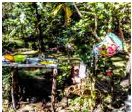
Point d'eau ménager extérieur – © F. Baumann/Le Banyan Bleu

Dans chacune des communes retenues pour l'étude, les dispensaires concernés recrutent 100 sujets, après consentement éclairé, répartis selon le sexe et l'âge.