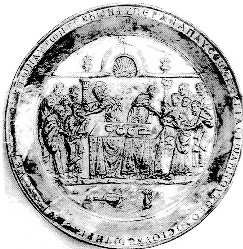
Fig. 1 : Patène du trésor de Kaper Koraon. Dumbarton Oaks Collection.