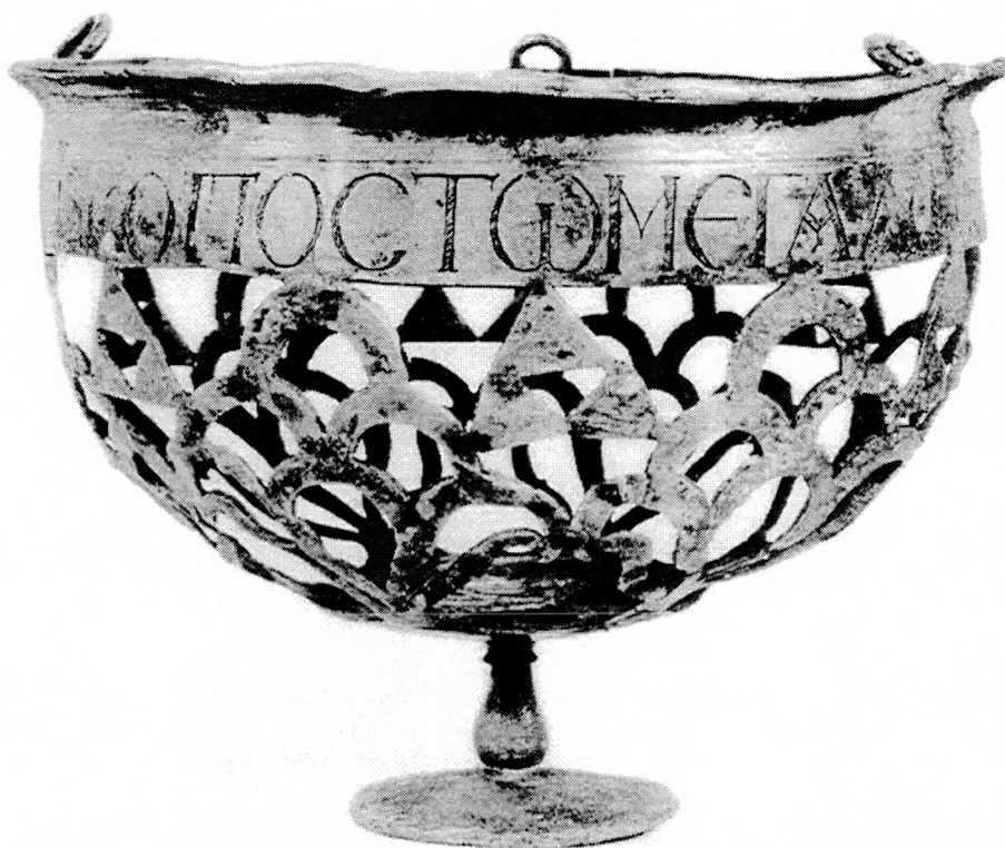
Fig. 4 : Lampe à paroi découpée du trésor de Sion (d. r.).