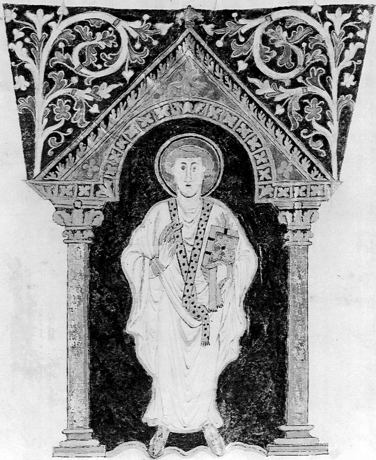
Fig. 2 : Saint-Gall, Bibliothèque abbatiale, Cod. 22, f° 14. Frontispice 2, Jérôme.