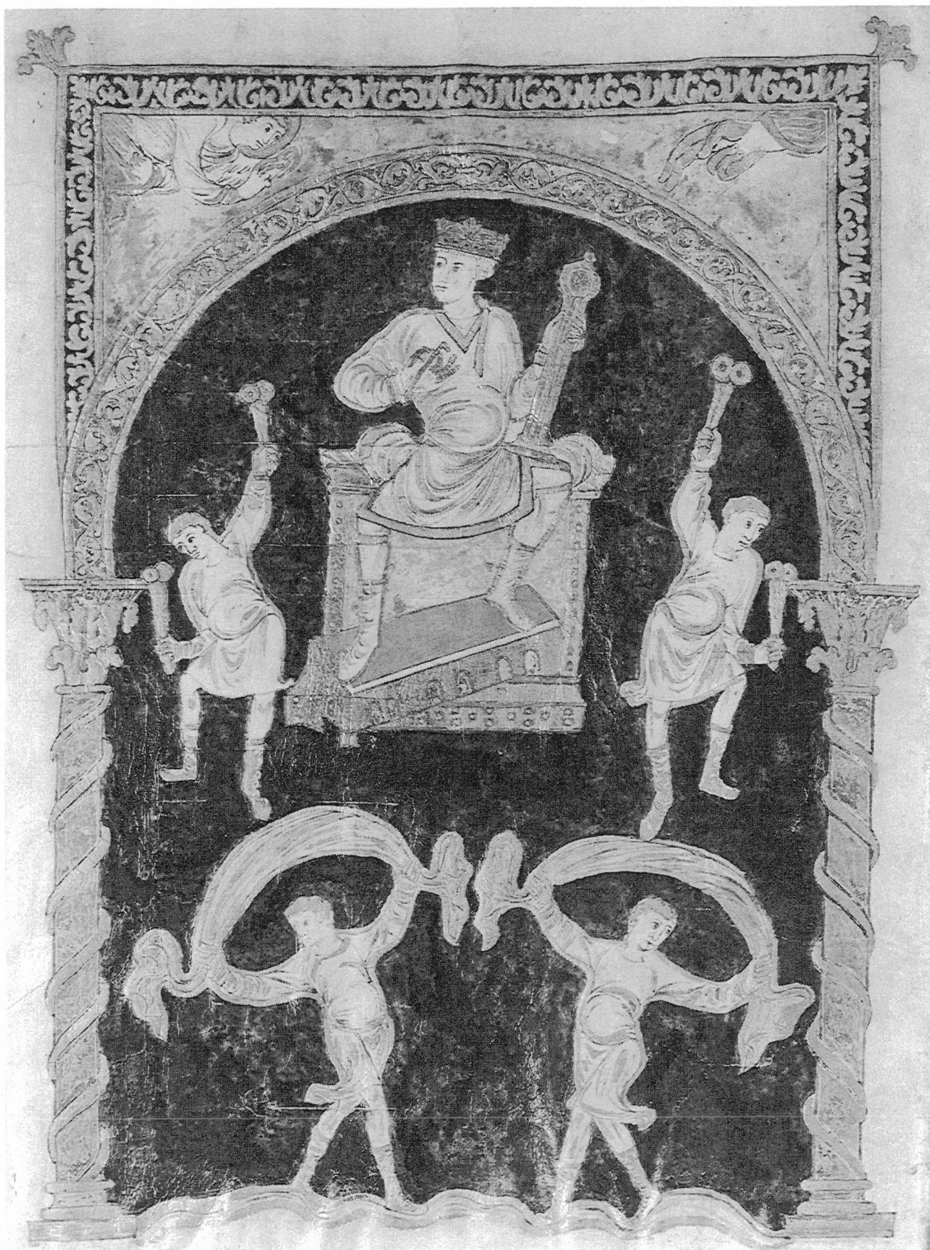
Fig. 1 : Saint-Gall, Bibliothèque abbatiale, Cod. 22, f° 2. Frontispice, David.