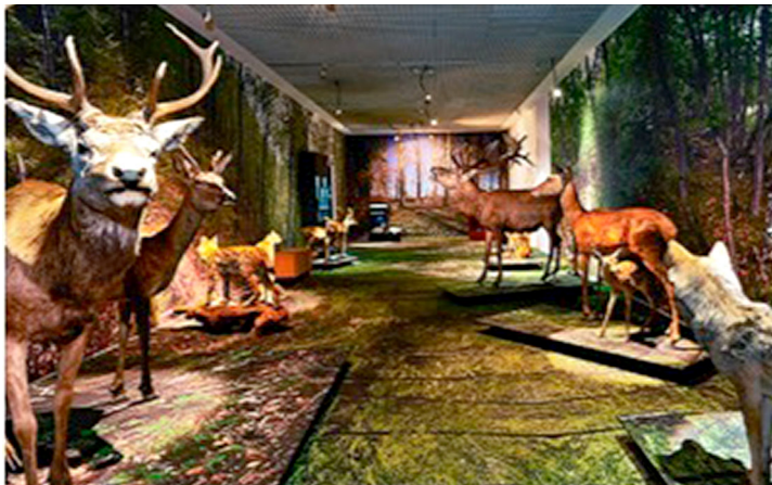
Fig. 2. Salas dedicadas al Paleolítico (a) y al Neolítico (b) del Museo de la Naturaleza.

El diseño y la articulación de las dos partes del juego Geome descansan en una metáfora que se traduce en un cambio de la relación del Hombre con la Naturaleza. Esta articulación se ve reforzada por la elección de un universo común que es introducido por una narración. Los jugadores son llevados a encarnar un único personaje, que representa a un profesional de la naturaleza. Esta figura vive y trabaja en una casa relativamente aislada en un valle (Fig. 3). En la primera parte del juego, se encontrará bloqueado debido a las condiciones climatológicas muy desfavorables. En consecuencia, aprovecha para explotar su entorno para sobrevivir. En la segunda parte del juego, liberado de las restricciones