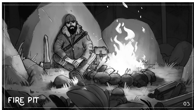
Fig. 4. Bosquejo del universo del juego Geome parte 1: personaje aislado en el valle (Créditos: Whitecross)

El juego ofrece tres tipos de investigación basados en un rumor, una noticia falsa o una polémica. El jugador puede tener que resolver una o más investigaciones según el momento del juego. Todos