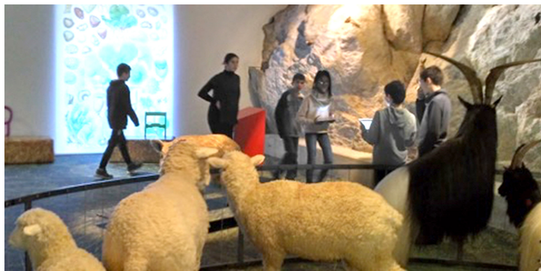
Fig. 5. Uso del juego en el Museo de la Naturaleza.