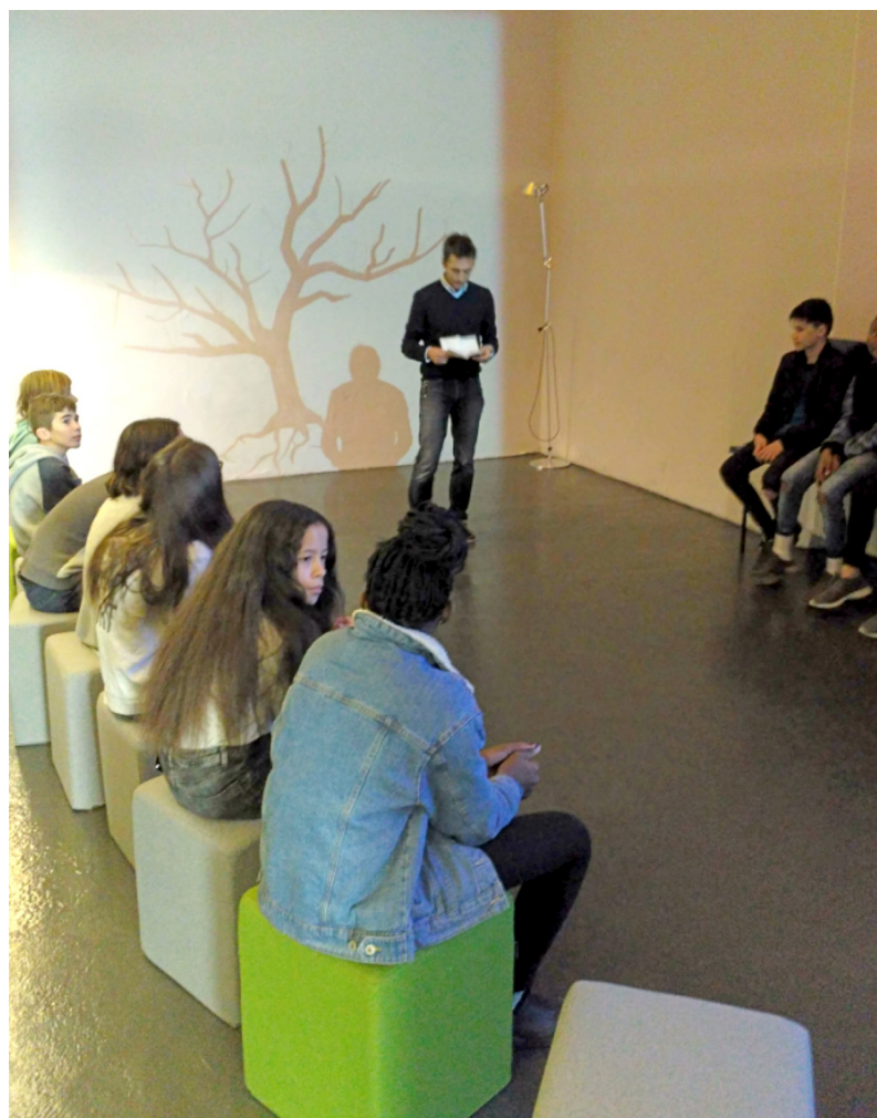
Fig. 7. Fase de debate dirigida por un monitor del Museo de la Naturaleza.

Los enigmas integran cuestiones regionales para interactuar con los elementos (vivos y no vivos) del Museo de la Naturaleza de Valais. Los retos pueden llevar a los jugadores a lidiar con varios problemas en los que se entrelazan diferentes disciplinas. Por ejemplo, uno de los acertijos se basa en una controversia en torno a un proyecto iniciado por una estación de esquí, que prevé la construcción de un embalse de agua para abastecer su creciente número de cañones de nieve. El objetivo es comparar diferentes puntos de vista, dependiendo de los tipos de testimonios recopilados por los jugadores, e identificar sus respectivos impactos en todo el ecosistema. El mapa sistémico así construido alrededor de esta controversia se basa en elementos del biotopo y la biocenosis, pero también integra elementos producidos o transformados por humanos. Las relaciones entre estos elementos son de naturaleza diferente y nos permiten considerar el ecosistema como un todo.