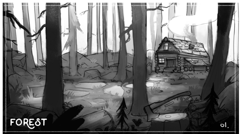
Fig. 3. Bosquejo del universo del juego Géome parte 1: chalet aislado