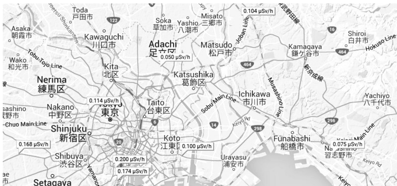
Figure 1. Carte agrégant des mesures ponctuelles de la radioactivité 2

Tout au long de l'accident nucléaire de Fukushima Daiichi, de nombreuses cartes ont été créées par des groupes de citoyens pour présenter la contamination radioactive des territoires. Il s'agit généralement de représentations cartographiques simples, intégrant des données ponctuelles relatives à la mesure de la radioactivité ambiante en un point et à un moment donné (Figure 1). Ces cartes présentent néanmoins une grande variété, traduisant la diversité de leur processus de création. Plusieurs caractéristiques peuvent être relevées pour expliquer ces différences, parmi lesquelles les sources des données cartographiées, les outils utilisés à cet effet, et les stratégies guidant l'implication des citoyens.