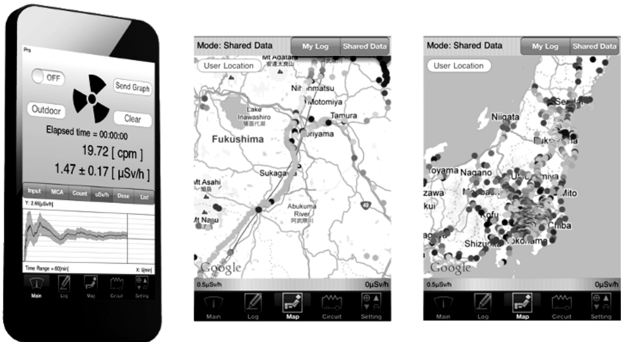
Figure 4. Application mobile des capteurs Pocket Geiger 6

D'autres outils, enfin, sont spécifiquement conçus pour un certain type de données, et donc un certain type de catastrophes. Aux premières semaines de l'accident de la centrale nucléaire de Fukushima Daiichi, plusieurs dispositifs ont ainsi été créés pour mesurer et cartographier la contamination radioactive des territoires. Le projet Safecast a développé des capteurs associés à des systèmes GPS (bGeigie), pouvant être déployés en différents lieux ou installés sur des véhicules, pour collecter des mesures géolocalisées qui sont ensuite agrégées sur une carte en ligne (Brown et al., 2016). Radiation Watch a également produit une gamme d'appareils de mesure à bas coût (Pocket Geiger ou Pokega), pouvant être connectés à des smartphones équipés d'une application dédiée (Figure 4), pour faciliter la mesure par les citoyens (Ishigaki et al., 2015). Après plusieurs années, les communautés qui se sont développées autour de ces deux dispositifs sont toujours actives et continuent de mesurer la radioactivité, au Japon et ailleurs. Les deux organisations ont par ailleurs entrepris d'adapter leurs outils à d'autres types de données environnementales, notamment relatives à la pollution atmosphérique, montrant qu'un glissement peut se produire entre la cartographie participative en situation de crise et la « captologie citoyenne » ordinaire (Allard, 2015).