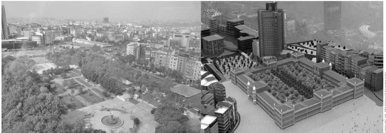
Image infographique de collectifs et place Taksim, Istanbul, (collage modifié), 2015