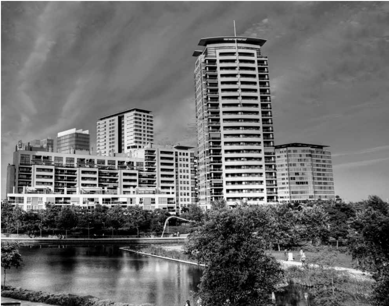
Entrée du Parc Diagonal Mar, 2011

Pour Diagonal Mar, les architectes-urbanistes en charge de ce projet sont Enric Miralles et Benedetta Tagliabue. Ils proposent d'inverser les valeurs d'agencement spatial, comme à Lisbonne avec le quartier de l'Exposition internationale de 1998 (Raposo, 2002), en créant un super îlot conçu non plus comme un îlot avec, en son centre, un espace vert, mais comme un grand parc