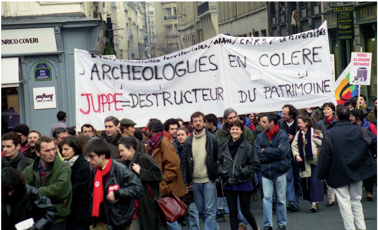
Fig. 2. Manifestation pour les droits et devoirs de l'archéologie préventive à Paris, en 1997. On y voit plusieurs de fondateurs de la revue Les nouvelles de l'archéologie .

de la technologie lancées par le ministre de la Recherche, Jean-Pierre Chevènement, une Journée de l'Archéologie à la Sorbonne, puis, les 18 et 19 décembre, des Journées nationales de la Recherche archéologique dont des numéros spéciaux rendirent compte (NDA 1981b, etc.).