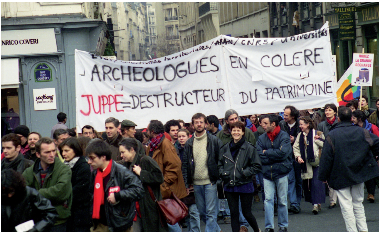
Fig. 2. Manifestation pour les droits et devoirs de l'archéologie préventive à Paris, en 1997. On y voit plusieurs de fondateurs de la revue Les nouvelles de l'archéologie .

de la technologie lancées par le ministre de la Recherche, Jean-Pierre Chevènement, une Journée de l'Archéologie à la Sorbonne, puis, les 18 et 19 décembre, des Journées nationales de la Recherche archéologique dont des numéros spéciaux rendirent compte (NDA 1981b, etc.).