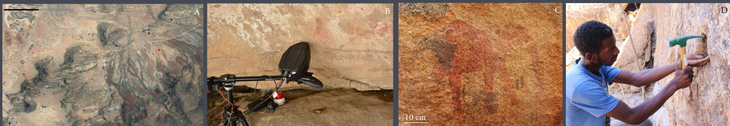
Figure 2: Matériel et méthode d'analyses in situ des peintures de l'Erongo. A: Localisation des sites pariétaux analysés (en bleu les sites analysés par XRF, en rouge ceux connus mais non analysés). B: Appareil XRF en cours d'analyse de peintures pariétales blanches (Ghost Cave). C: Figures rouge (éléphant) et noires (équidé) superposées analysées par XRF sur le site d'Elephant Wall (EW). D: Collecte de matières colorantes riches en hématite avec l'aide de Peter Gariseb (« small miner » de Üiba-Oas Crystals Market (Usakos, Erongo, Namibia)).