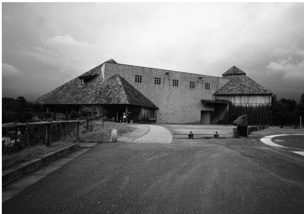
Musée municipal, architecte Fujimori Terunobu (1998), Hamamatsu, Chizuoka

Avec le transfert de technologie qui marque l'occidentalisation du Japon à l'ère Meiji, ce matériau est partiellement délaissé au profit du stuc, de la brique et du béton utilisés dans la construction d'édifices de style occidental. Suivant la tradition japonaise, le béton ayant été importé de l'Occident, son nom est adapté phonétiquement en katakana . Il sera ainsi transcrit de l'anglais concrete en konkurīto * コンクリート. Le terme fait à son tour l'objet d'une retranscription en kanji dans lequel nous retrouvons le signe tsuchi/do 土 : 混凝土 (« mélanger » kon + « durcir/condenser » koru + « terre » to ).