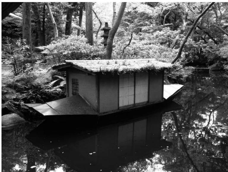
Pavillon de thé flottant dans la fraîcheur, barque avec habitacle en terre, musée Nezu, Tokyo

citons encore fūdo * 風土 (littéralement : le « vent » et la « terre »). Le dictionnaire GC traduit ce terme par « nature d'un milieu naturel », « climat » (GC), mais Augustin Berque a élargi son champ sémantique pour y inclure le facteur humain et le traduire par « milieu ». Cette notion intègre à la fois l'environnement, l'homme, et leur interaction. Le nom du plus grand marché aux poissons du Japon, situé à Tokyo : Tsukiji 築地 ( kizu [ ku ] • chiku : « construire », « empiler » + chi • ji : « sol »), n'est autre que le terme qui désigne le dispositif spatial sur lequel il a été construit, soit une zone de terre gagnée sur la mer umetate-chi *. Citons enfin le populaire o-miyage お土産 (« terre » + « naissance, production » : littéralement « produit localement »), un « souvenir » ou « cadeau de voyage » (GC) que chaque Japonais se doit d'offrir à sa famille et à ses collègues de travail, au retour d'un déplacement effectué au-delà des limites de sa propre région. La sphère d'utilisation extrêmement large de tsuchi 土 ne nous permet pas de citer ici tous les exemples de notions s'y rapportant. On pourra cependant en apprécier la force symbolique en lisant Tsuchi , le célèbre roman à caractère ethnographique du poète et écrivain Nagatsuka Takashi 長塚節 (1879-1915) publié en 1912, qui décrit la