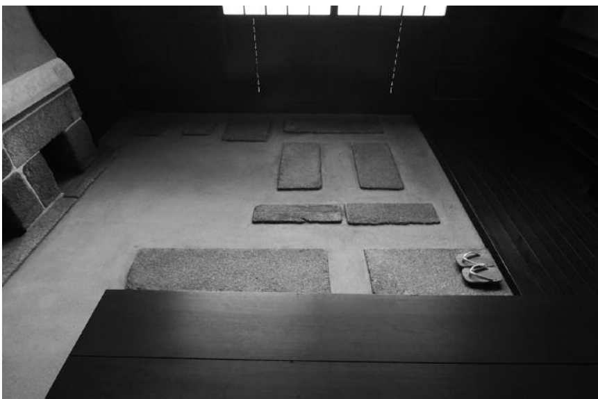
Sol en terre battue tataki incrusté de dalles de granit, temple Obai-in, Daitoku-ji, Kitaku, Kyoto, © Rokutanda Chie, 2008

sus de stylisation du dessin représentant le ou les éléments qu'il désignait à l'origine. Ainsi, d'après le SSJ, la première image attribuée à l'origine de tsuchi est une boule de terre de forme allongée, placée sur un socle, l'ensemble servant d'objet culturel. C'est donc un élément emprunt de spiritualité, comme en témoigne la présence du signe tsuchi 土 dans l'un des deux idéogrammes qui composent « sanctuaire shintō » : jinja * 神社 = « divinité » [ kami ] + « temple shintoïste » (GC) [ yashiro ].