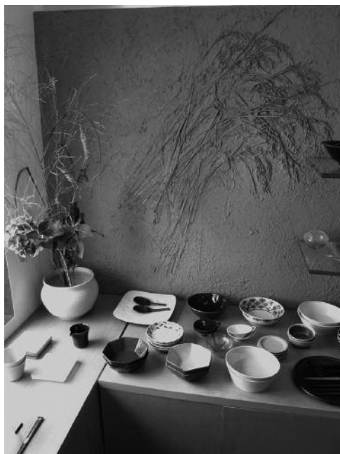
Mur de terre tsuchi kabe orné d'épis de riz, dans un magasin de céramique, Tokyo