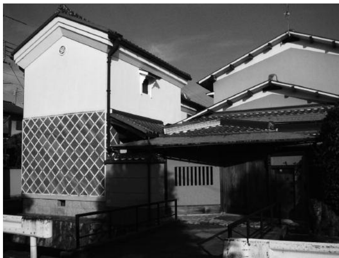
Dozō 土蔵 avec un mur namiako (revêtement de tuiles dont les joints en plâtre sont saillants), Kyoto.

répondent à la même appellation de kura . On y trouve des mots aussi variés que misogura 味噌蔵 (fabrique/entrepôt à miso), sakagura 酒蔵 (fabrique/entrepôt à saké), hōzō 宝蔵 (grenier à trésor), jizō 地藏 (bodhisattva, esprit protecteur des voyageurs et des enfants), reizōko 冷蔵庫 (réfrigérateur), sōko 倉庫 (entrepôt, magasin, réserve) ou encore shako 車庫 (garage, dépôt). Dans le système de lecture sino-japonais ( on-yomi ), les trois idéogrammes se lisent respectivement zō 蔵, sō 倉 et ko 庫.