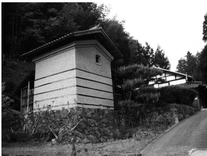
Dozō 土蔵 en torchis brut avec un toit surélevé, Kyoto.

Il existe une grande variété de termes désignant des dispositifs spatiaux ou des objets du quotidien, composés par l'association d'un ou de plusieurs idéogrammes avec l'un de ceux qui, dans le système de lecture japonais ( kun-yomi ),