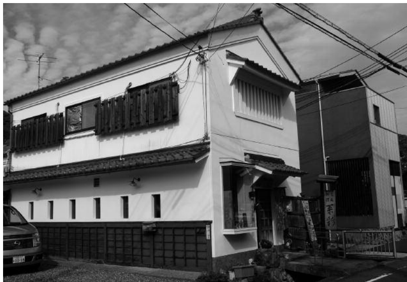
Exemple d'usage contemporain d'un kura converti en salle de restaurant, Matsugazaki, Kita-ku, Kyoto, © Ph. Bonnin, 2011

Pour en savoir plus : ITŌ Teiji, 1973; KAWAZOE et al., 1979; TAKAI, 1995.