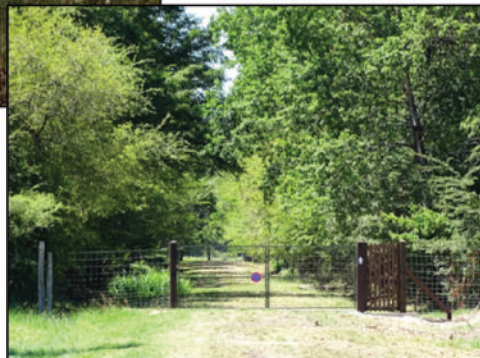
Photo 2 Les grillages, outils de mise en défens de la réserve et de prévention des dégâts par la faune sauvage