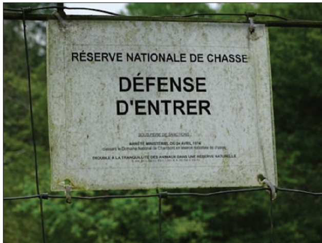
Photo 1 Chambord, une réserve nationale de chasse dont l'accès est interdit au public

Aujourd'hui, le Domaine national de Chambord est une réserve nationale de chasse dont l'accès est interdit au public (photo 1, ci-dessous).