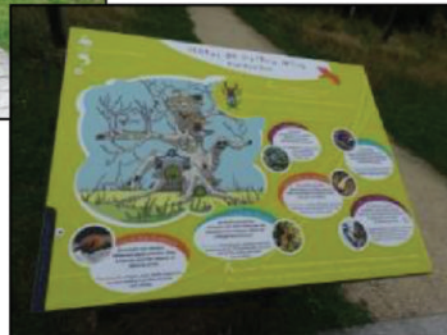
Photo 3 Actions d'information et de sensibilisation à la préservation de la nature à destination des touristes