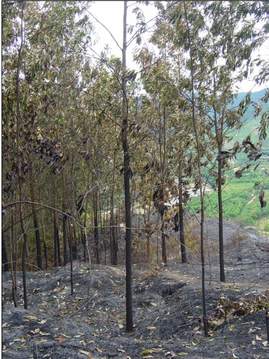
Clichés : A. Robert, 2006, Khe Tre (province de Thua Thiên Huê, Viêt Nam).

Récemment, on apprenait, par le ministre indonésien de l'Environnement et des Forêts, « que près de 135 747 hectares avaient été brûlés dans [son] pays entre janvier et juillet 2019 » ( Le Figaro international 10 ), générant des fumées toxiques qui affectaient aussi les pays voisins : on évoquait « plusieurs centaines d'écoles [obligées] à fermer en Asie du Sud-Est, impactant plus de 150.000 élèves » ; une détérioration de la qualité de l'air à Kuala Lumpur (Malaisie) atteignant « un « niveau néfaste à la santé », selon l'indice officiel » et « à Singapour comme en Thaïlande, les autorités s'inquiét[ai]ent et conseill[ai]ent aux habitants de porter des