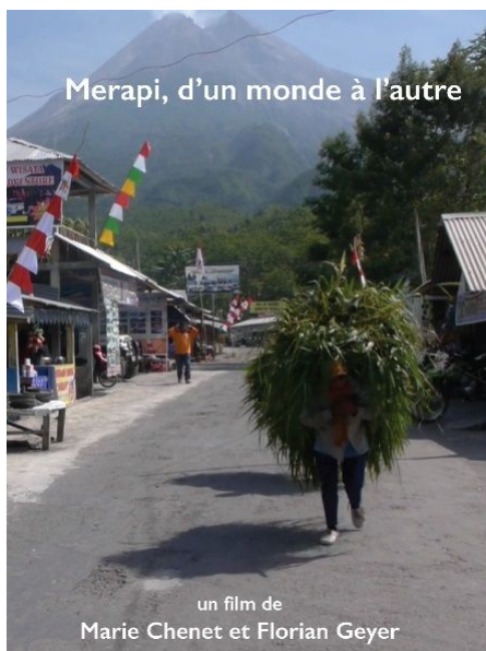
Image 3 : Le troisième film dans lequel j'ai filmé des individus en situation de travail a été coréalisé avec Florian Geyer en 2016 et s'intitule Merapi, d'un monde à l'autre 4 .

Produit dans le cadre du projet de recherche Sedimer (2012-2014, financement Fondation Axa), il traite de la façon dont le territoire dévasté par l'éruption du volcan Merapi en 2010 (Java, Indonésie) est réinvesti par la population locale, tant sur le plan économique que socioculturel, quatre ans après la catastrophe. On y voit notamment le volcan comme une ressource économique puisque l'éruption a permis l'essor d'une activité touristique tous azimuts, mais aussi une intensification de l'exploitation des sables volcaniques qui a attiré de nombreux travailleurs dans la région. Nous montrons également comment l'éruption s'est soldée par une réorganisation des structures sociales (passage d'un habitat dispersé à un habitat regroupé, modification des pratiques agricoles) et l'abandon d'un islam empreint de syncrétisme au profit d'un islam « arabe ». Le film est construit comme un cheminement allant des sites détruits par l'éruption aux nouveaux lieux de vie de la population. Dans chaque lieu, des acteurs locaux racontent la façon dont ils ont vécu et accompagné ce bouleversement territorial.