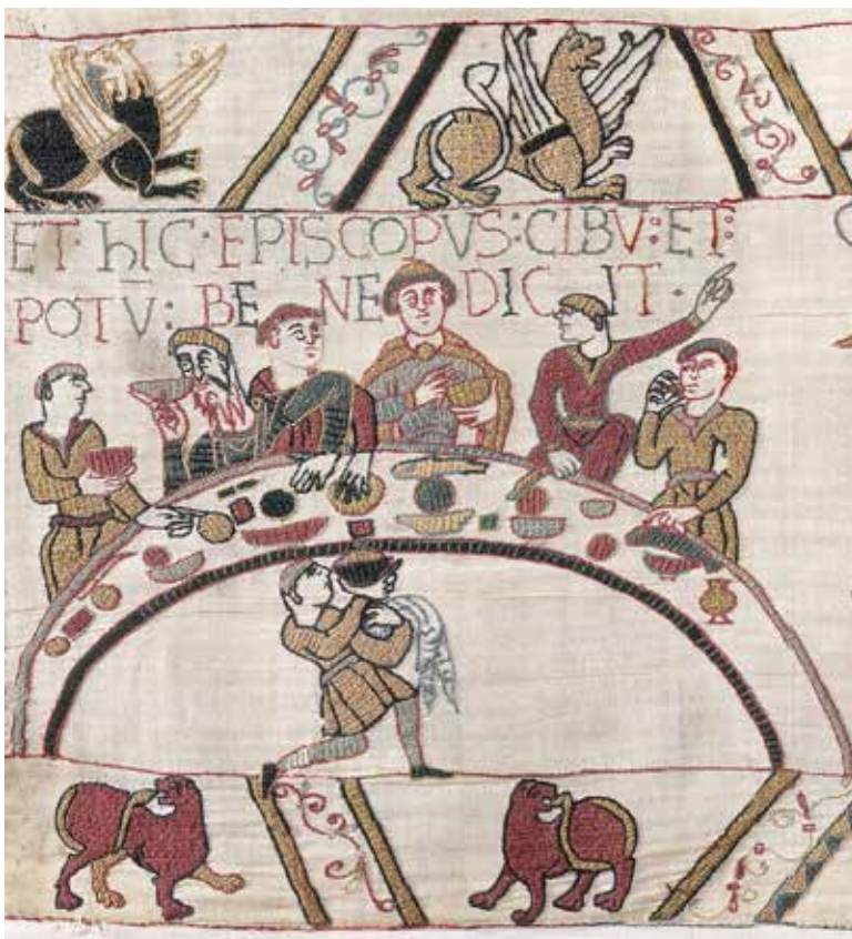
Fig. 2 – Détail de la Tapisserie de Bayeux, XI e siècle.

Le repas des dignitaires, (42) encadré de lions ailés et de lionnes.