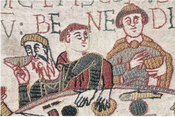
Fig. 10 – Détail de la Tapisserie de Bayeux, XI e siècle

dire comment. Une vision immédiate et quasi documentaire de l'Histoire court tout le long de l'ouvrage, conforme aux témoignages et aux souvenirs parfois traumatiques des contemporains. La présence des fables marginales comme l'imitation d'enluminures leur superpose une portée réflexive et ouvre une dimension métaphorique. La mort n'a pas le dernier mot. La performance rituelle signifie – à chaque pas – que les corps que vous voyez tomber sans sépulture entrent dans le repos de Dieu. Dans sa matérialité, la toile en déroule le mémorial funéraire et glorieux.