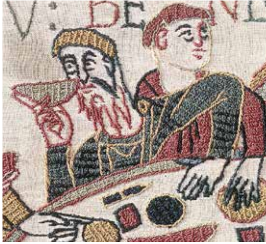
Fig. 1 – Détail de la Tapisserie de Bayeux, XI e siècle