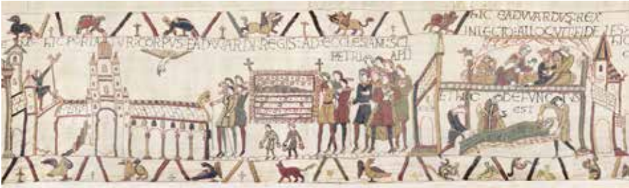
Fig. 8 – Détail de la Tapisserie de Bayeux, XI e siècle