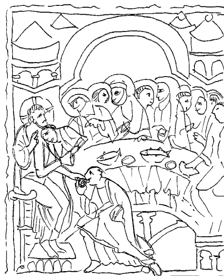
Fig. 9 b - D'après la Cène, Psautier de Saint Alban, Historic Collection of University of Aberdeen, vers 1119-1123

l'enluminure anglo-saxonne selon deux mises en espace qui se trouvent contaminées dans le carton du brodeur associant plastiquement la symétrie de l'une et le dynamisme de l'autre. La loi du cadre explique cette apparence en « croissant » de la table ronde 25 .