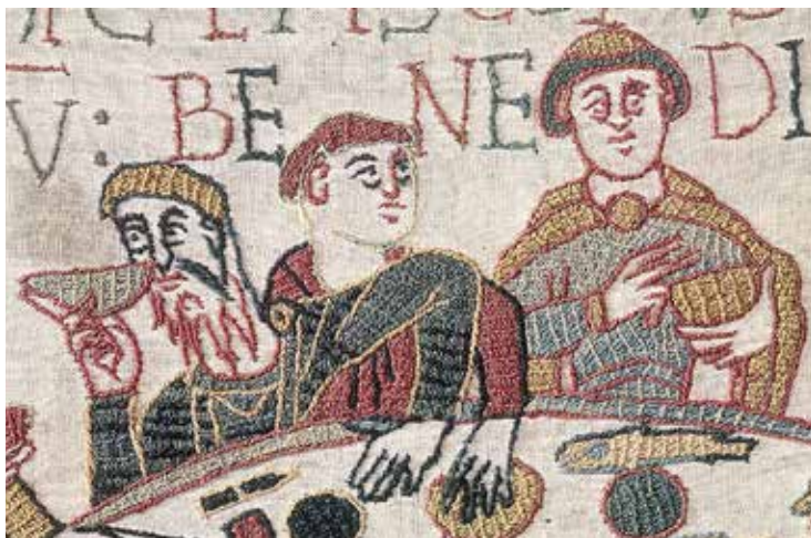
Fig. 10 – Détail de la Tapisserie de Bayeux, XI e siècle

dire comment. Une vision immédiate et quasi documentaire de l'Histoire court tout le long de l'ouvrage, conforme aux témoignages et aux souvenirs parfois traumatiques des contemporains. La présence des fables marginales comme l'imitation d'enluminures leur superpose une portée réflexive et ouvre une dimension métaphorique. La mort n'a pas le dernier mot. La performance rituelle signifie – à chaque pas – que les corps que vous voyez tomber sans sépulture entrent dans le repos de Dieu. Dans sa matérialité, la toile en déroule le mémorial funéraire et glorieux.