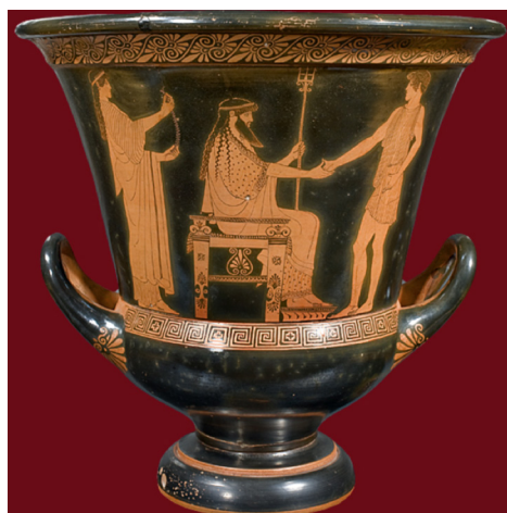
Figure 1 : Cratère en calice représentant Poséidon et Thésée.

Nous nous sommes intéressés à la céramique athénienne dont la suprématie s'est exercée dès 550 av. J.-C. dans le monde grec, le quartier du Céramique à Athènes devint alors l'unique centre de fabrication, Athènes exportant largement sa production. Parmi les différents types de poteries et les différentes périodes qui se sont succédé, nous avons choisi de nous intéresser plus particulièrement aux vases de l'époque archaïque et classique, en s'appuyant sur différentes sources provenant, entre autres, des archives Beazley du Centre de Recherche sur l'Art Classique de l'Université de Oxford (Beazley 2019), des livres « Athenian Black Figure Vases » (1974) et « Athenian Red Figure Vases » (1975) de John Boardman, le livre « Athenian Vase Construction. A Potter's Analysis » de Toby Schreiber (1999), le livre « Greek Painted Pottery » de Cook R. M. (1997), le « Visual Glossary of Greek Pottery » de Cartwright, M. (2013), le livre de G. Richter et Marjorie Milne (1935) « Shapes and Names of Athenian Vases », ainsi que du Thesaurus AAT Getty (AAT Getty 2019).