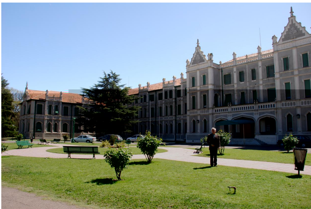
Imagen 5. Hotel de Oficiales.

3. Hotel de Oficiales: inaugurado en 1937, es un ejemplo de la utilización de la tipología Tudor y por su emplazamiento en un espacio abierto y verde, goza de una buena perspectiva para ser apreciado en toda su magnitud. Consta de 123 habitaciones y 87 departamentos. 22