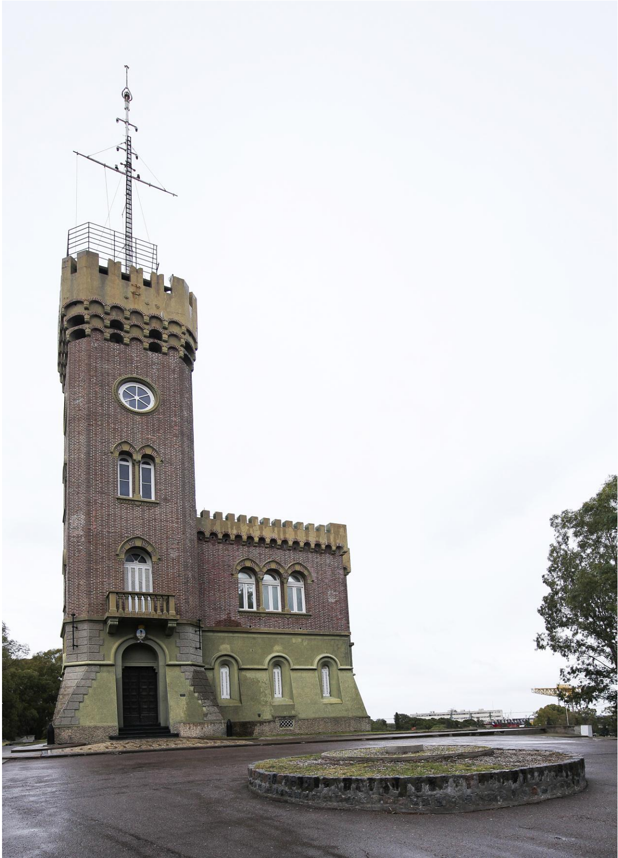
Imagen 4. Torre de Señales.