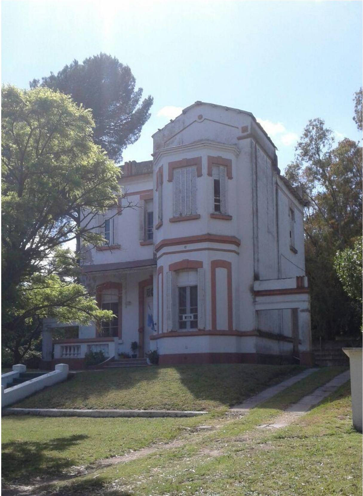
Imagen 6. Casa Jirafa.