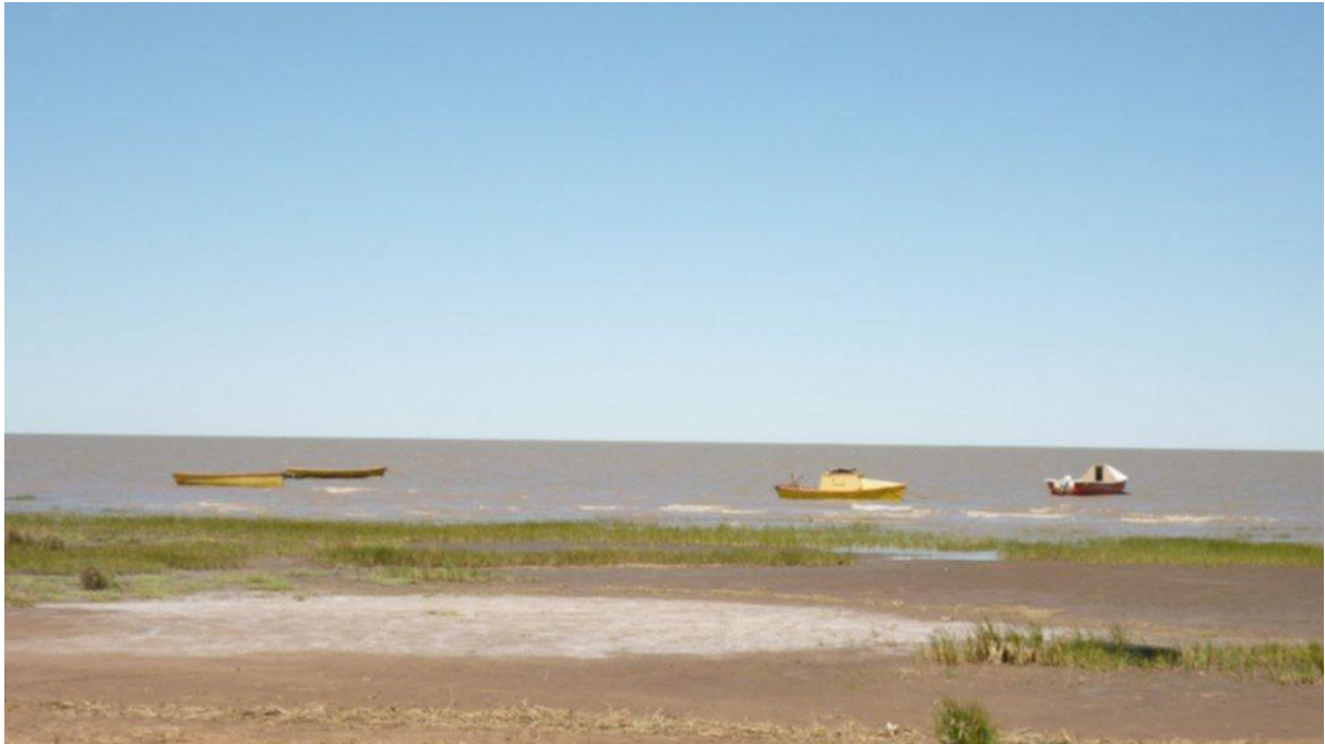
Imagen 3. Humedal de Villa del Mar.

La zona costera no sometida a los cambios que supusieron la construcción de los puertos, se conserva en forma más o menos natural en Puerto Belgrano, aunque cubriendo el área reducida no sometida a los cambios antrópicos que significan los puertos y sus instalaciones. Aunque está sometida a una gran presión derivada de la urbanización del área, las actividades portuarias y la creciente contaminación del estuario por la acción de las industrias radicadas en la cercana ciudad de Bahía Blanca.