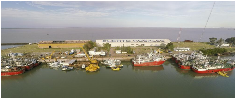
Imagen 7. Buques en el muelle de Puerto Rosales.

semihundidos en el cangrejal del Arroyo Pareja. 31 Hoy en día funciona como un puerto cuyo muelle sirve como atracadero para embarcaciones que realizan carga y descarga de mercaderías y también para realizar reparaciones de cascos. Pero su actividad principal es el embarque petrolero, a través de la utilización de las dos monoboyas en la terminal de Punta Cigüeña.