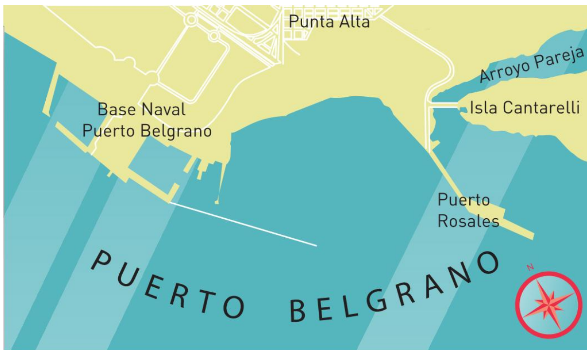
Imagen 2: Área de Puerto Belgrano. Archivo Histórico Municipal de Punta Alta

Puerto Belgrano fue por primera vez explorado y descrito en enero de 1825 por la misión a aguas australes del bergantín de guerra General Belgrano , de quien toma su nombre. 13 Hasta la última década del siglo XIX la zona estuvo muy poco habitada, con una población rural dispersa dedicada a tareas pecuarias.