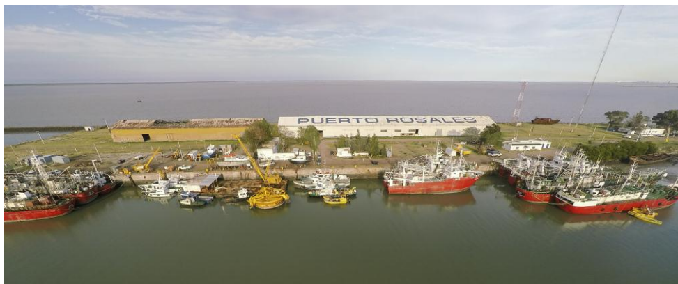
Imagen 7. Buques en el muelle de Puerto Rosales.

semihundidos en el cangrejal del Arroyo Pareja. 31 Hoy en día funciona como un puerto cuyo muelle sirve como atracadero para embarcaciones que realizan carga y descarga de mercaderías y también para realizar reparaciones de cascos. Pero su actividad principal es el embarque petrolero, a través de la utilización de las dos monoboyas en la terminal de Punta Cigüeña.