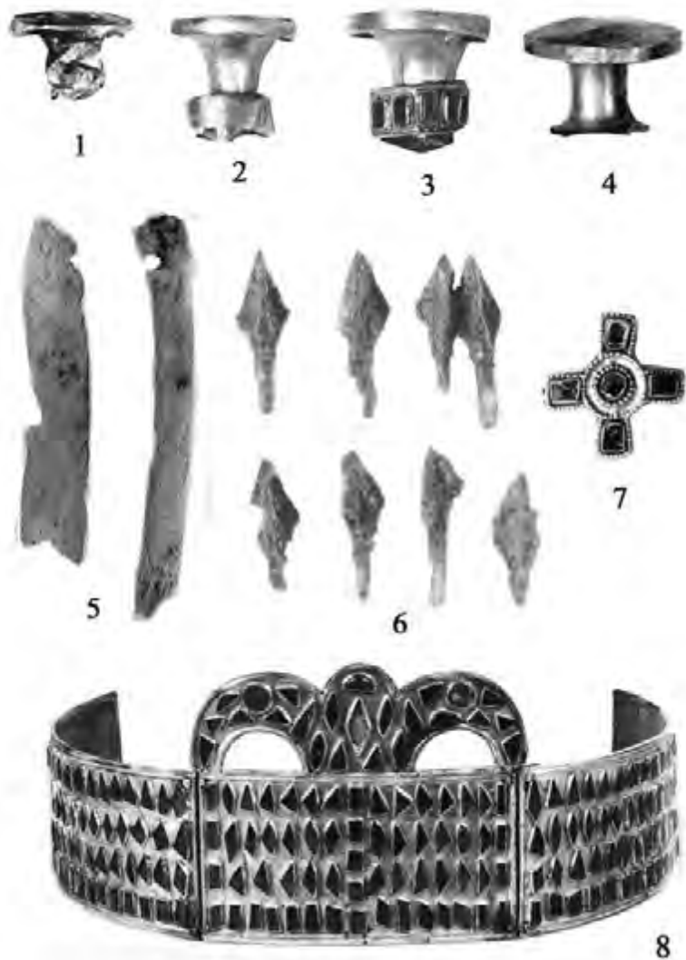
Рис. 1. Вещи гуннской традиции из Керчи.

1-3: тайник склепа 145.1904 г.; 4: склеп 1914 г., у Тарханской дороги; 5, 6: склеп 154.1904 г.; 7: контекст находки неизвестен; 8: склеп 1907 г., в Митридат. 1-6: по Засецкая, 1993; 7: по Датт 1988; 8: по Eger, 2017