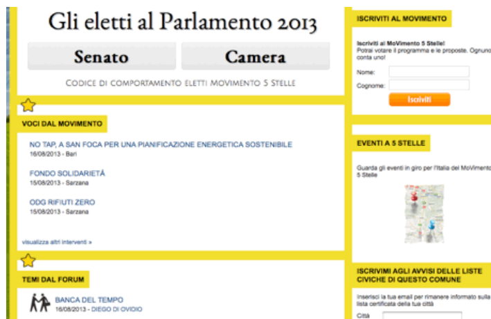
Fig. n° 2 Copie d'écran de l'espace du blog dédié au Mouvement 5 étoiles - 16 août 2013