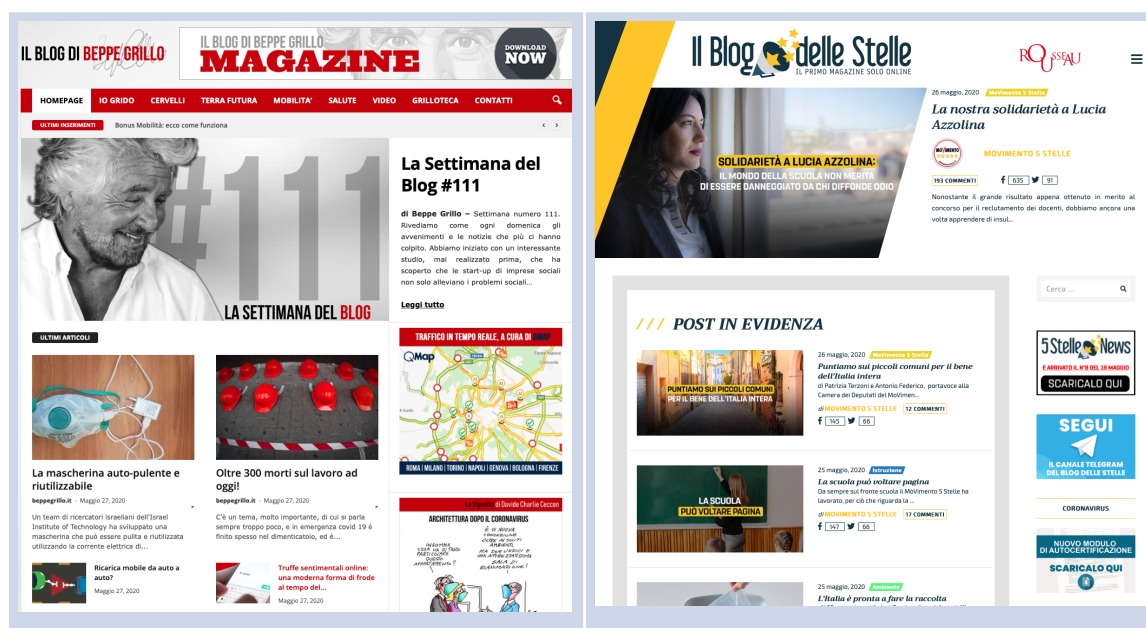
Fig. 3 : captures d'écran du nouveau blog de Grillo (image à droite) et du blog des étoiles (à gauche); mai 2020.

L'analyse thématique menée sur les publications parues en mars 2018 démontre que le blog des étoiles est entièrement consacré à la diffusion de l'information relative à l'actualité politique et à l'action législative du M5S. Les signatures du blog reflètent les différents thèmes de l'agenda politique mais aussi la composition polyphonique du mouvement : les administrations des régions (10 posts); l'association Rousseau qui gère la plateforme de participation politique en ligne (9 publications dont 7 signées par le président Davide Casaleggio, fils du cofondateur du M5S); les administrations municipales (12 posts consacrés principalement aux municipalités étoilées de Turin et Rome); les élus au parlement européen (12 posts); les messages du chef politique Luigi Di Maio (25 posts); les élus au Parlement et au Sénat (16 posts) et, enfin, les publications de la rédaction (35 posts). Les membres du mouvement sont appelés à se familiariser, via le blog, avec les thèmes et les projets politiques