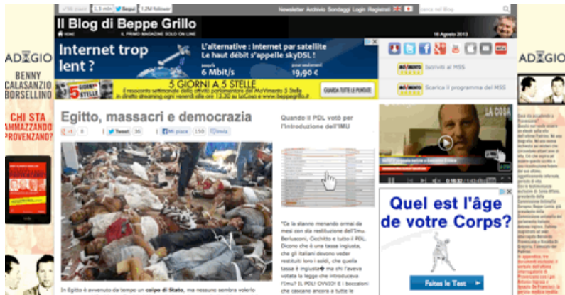
Fig n°1 : capture d'écran de la page d'accueil du blog de Grillo - 16 août 2013