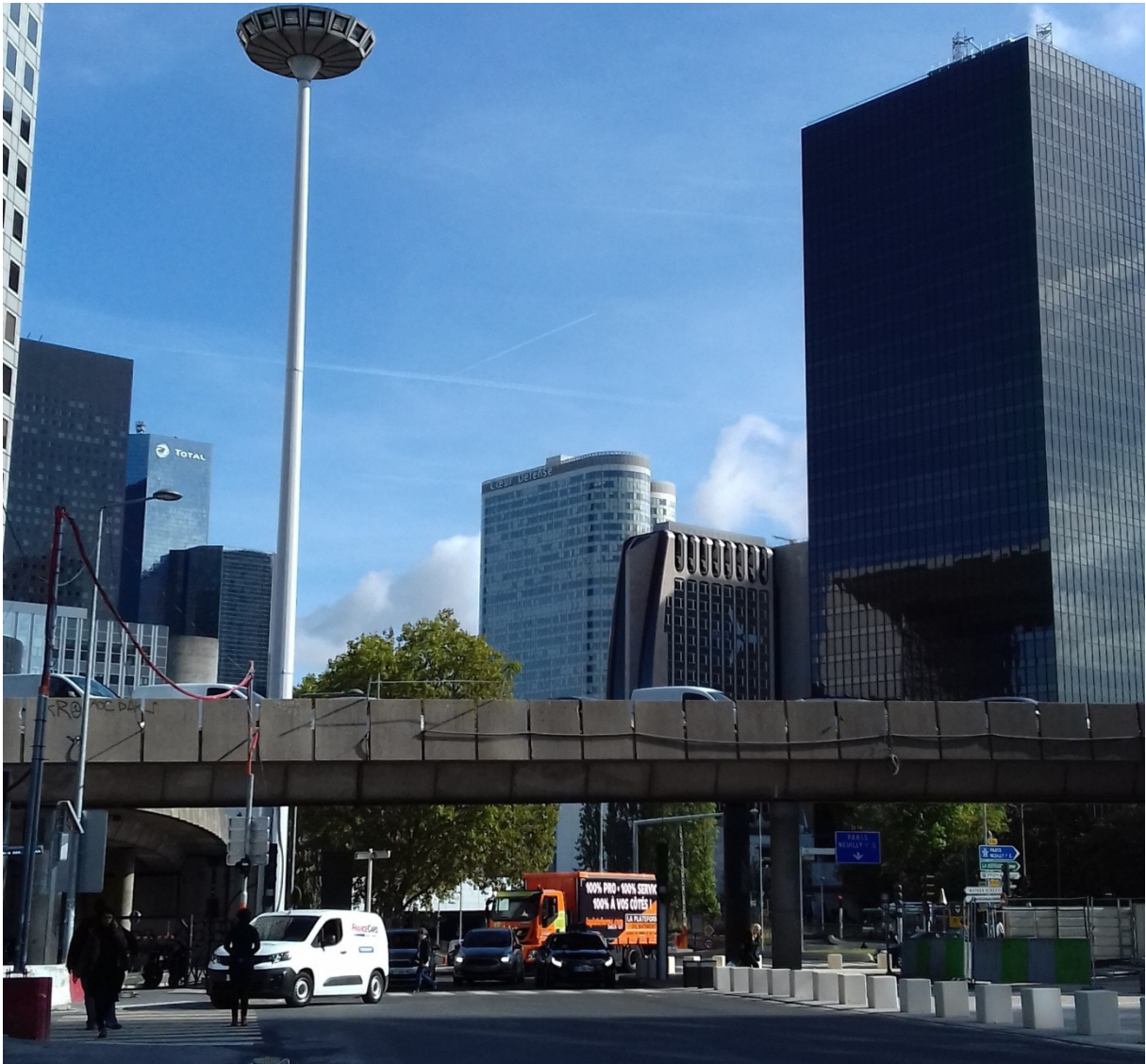
1. Les dessous de la Défense (Roseline RABIN, 2019)