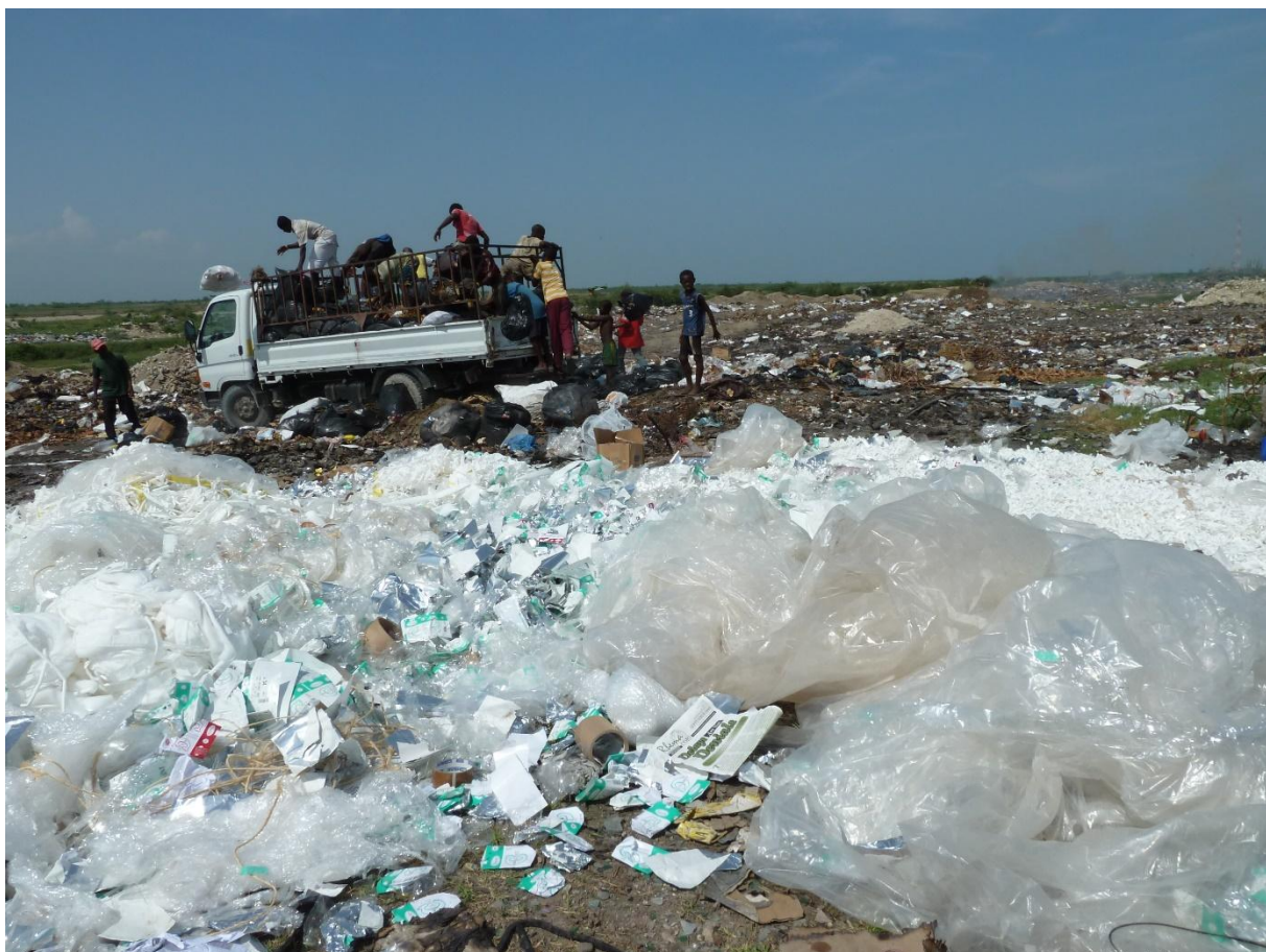
Arrivé quelques minutes auparavant, ce camion a déjà été vidé et les chiffonniers débutent le travail de tri.