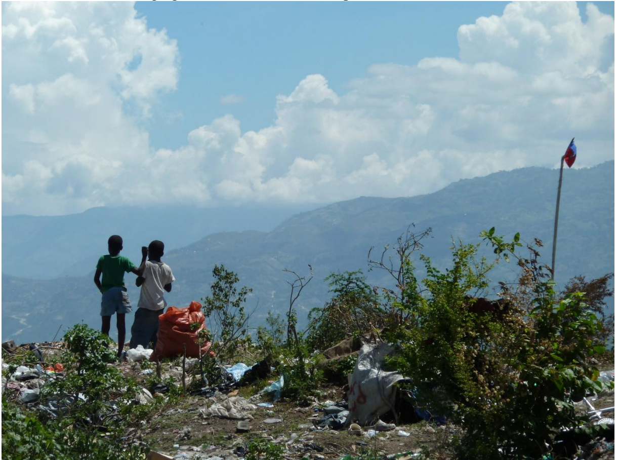
Un drapeau haïtien a été dressé près des ballots de matières récupérées par les jeunes chiffonniers. Au fond, les mornes où s'étend le camp-ville de Canaan.

Les récupérateurs des décharges ne sont pourtant pas à la première étape de la chaîne. Auparavant, une grande partie des déchets est déjà filtrée par les familles elles-mêmes, qui savent user au mieux des rebus, puis par les nombreux mendiants ou ramasseurs qui fouillent les poubelles, sacs et éventuelles bennes dans la ville. Le parcours des objets est donc difficile à suivre, mais ils mettent du temps avant de réintégrer le secteur formel, par exemple pour être retransformés à plus grande échelle. Ils demeurent alors dans le cadre d'usages récurrents dans l'informalité haïtienne : la « débrouille », telle qu'elle est nommée en créole. Ces différentes chaînes de récupérations n'en demeurent pas moins des éléments importants dans l'économie urbaine et sociale qui pallie les déficiences étatiques.