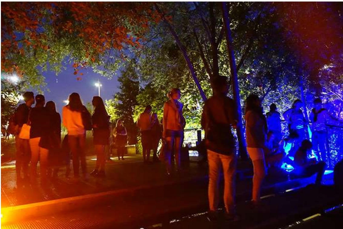
Clairière avec les promeneurs – Workshop international » Paysage de Lumière » 2014, Ile de Nantes

Dans la clairière, une étrange sérénité s'emparait des visiteurs. Ils parlaient silencieusement et créaient une ambiance de calme. Quel contraste d'ailleurs avec le soir de l'installation qui avait plutôt transformé ce lieu en un salon festif intimiste !