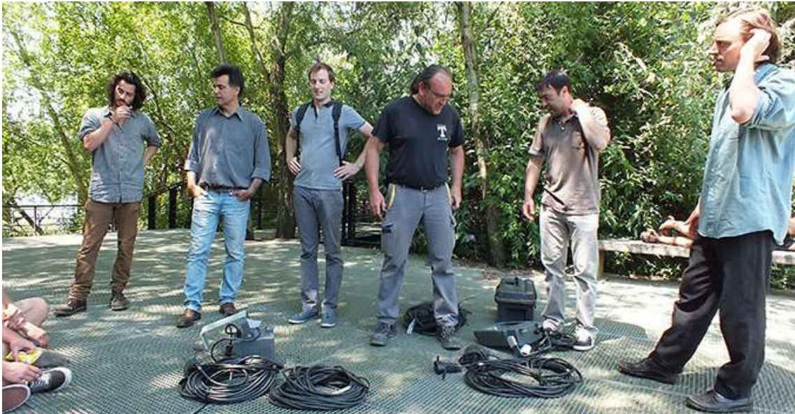
Installation avec l'Eclairage Public de Nantes Métropole – Workshop international » Paysage de Lumière » 2014, Ile de Nantes