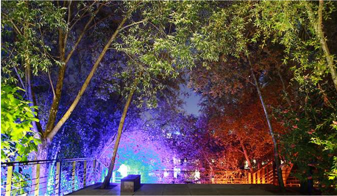
Clairière durant le Workshop international » Paysage de Lumière » 2014, Ile de Nantes – Photo : Laurent Lescop

La passerelle a fait l'objet d'une installation plus complexe autour d'une structure tridimensionnelle en métal. Un film de cellophane a été enroulé sur les poutres supérieures créant ainsi une toiture vibrante. Les sources lumineuses ont été placées dans les roseaux sous la passerelle ou sur les culées. Le résultat était assez fascinant. L'éclairage passait à travers le caillebotis métallique, le faisant flotter au-dessus des roseaux créant un vrai effet de lévitation. Au-dessus des têtes, la lumière se reflétait sur la cellophane suggérant la présence de l'eau par des caustiques.