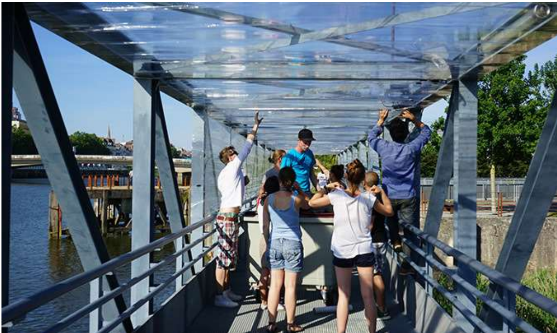
Passerelle en cours d'installation – Workshop international » Paysage de Lumière » 2014, Ile de Nantes

La passerelle a fait l'objet d'une installation plus complexe autour d'une structure tridimensionnelle en métal. Un film de cellophane a été enroulé sur les poutres supérieures créant ainsi une toiture vibrante. Les sources lumineuses ont été placées dans les roseaux sous la passerelle ou sur les culées. Le résultat était assez fascinant. L'éclairage passait à travers le caillebotis métallique, le faisant flotter au-dessus des roseaux créant un vrai effet de lévitation. Au-dessus des têtes, la lumière se reflétait sur la cellophane suggérant la présence de l'eau par des caustiques.