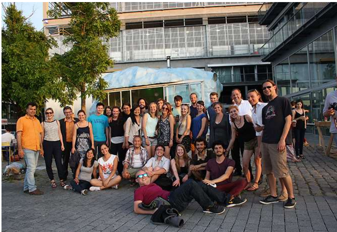
Participants du Workshop international » Paysage de Lumière » 2014, Ile de Nantes – Photo : Laurent Lescop

Une autre image, c'est celle des promeneurs qui s'arrêtaient redécouvrant des lieux devant lesquels ils avaient l'habitude de passer, s'émerveillant. Il reste un souvenir fort : l'énergie joyeuse qu'ont apportée les techniciens de Nantes Métropole. Ils ont vraiment porté les étudiants.