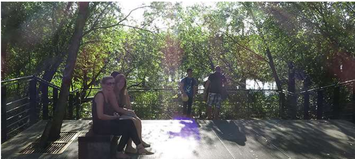
Clairière derrière derrière le Carrousel des Fonds Marins, Ile de Nantes

Nous nous sommes installés sur l’Ile de Nantes, sous le Carrousel des Fonds Marins. Il y a une passerelle et une petite clairière que personne ne semble avoir repéré. Ce sont des lieux de passage, éclairés de façon fonctionnelle pour le premier, laissé dans l’obscurité pour le deuxième.