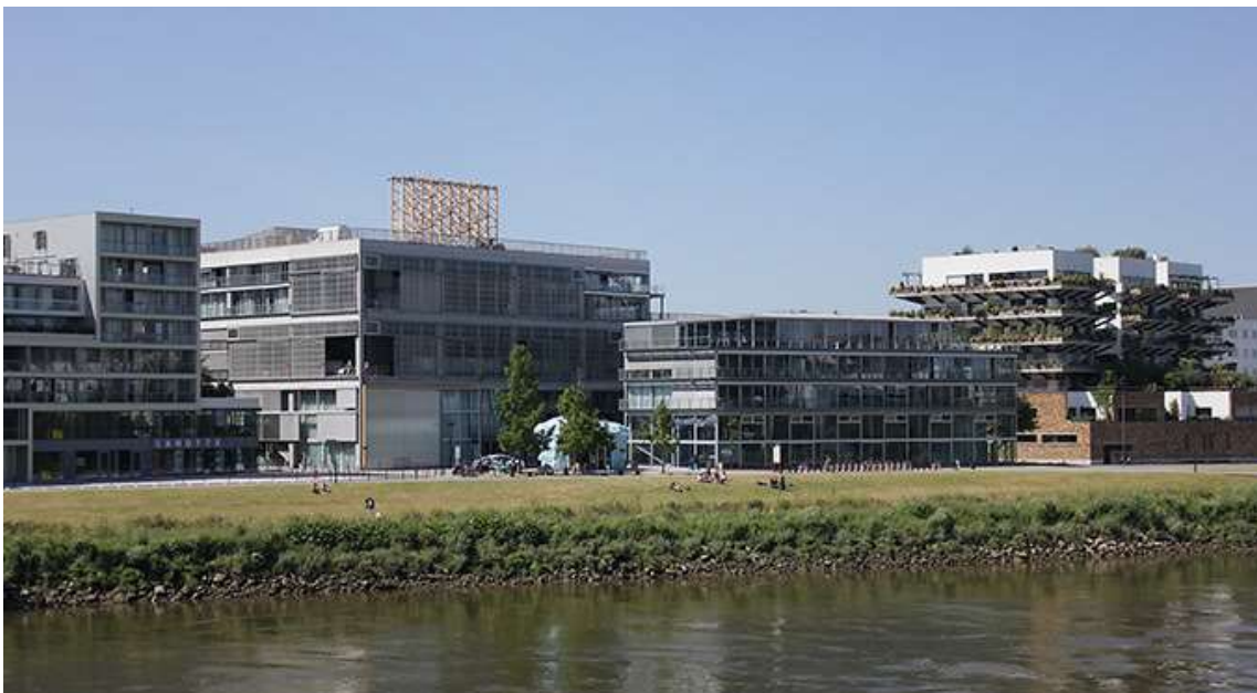
École nationale supérieure d'Architecture de Nantes

La lumière est peu enseignée chez les architectes. La lumière naturelle est un peu évoquée ici et là. La lumière artificielle n'est pas ou peu abordée. Les étudiants ont réellement découvert une nouvelle discipline, fascinante car finalement extrêmement réactive. Ils prennent un projecteur en main, l'allument et le monde se transforme déjà !