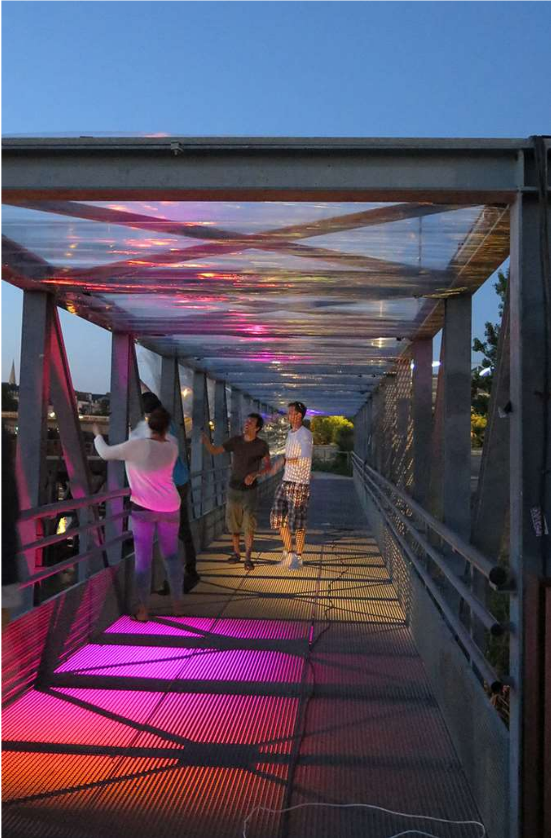
Passerelle durant le Workshop international » Paysage de Lumière » 2014, Ile de Nantes – Photo : Jakub Charkiewicz