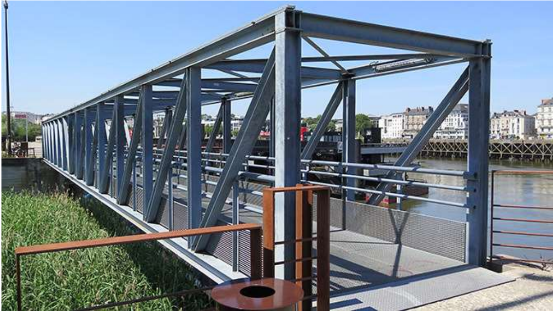
Passerelle sur une cale à bateau, Ile de Nantes – Photo : Jakub Charkiewicz

Les étudiants ont même inventé un protocole pour que les divergences puissent être discutées sereinement.