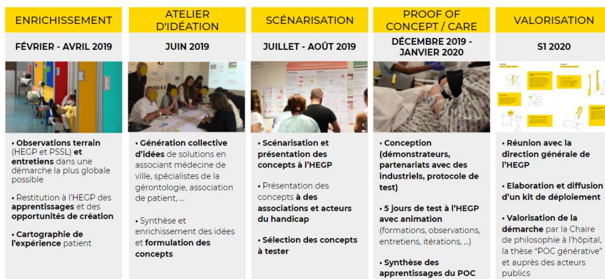
Figure 2 : Synthèse des grandes étapes de la démarche de design

La Figure 2 présente la démarche suivie par les designers :