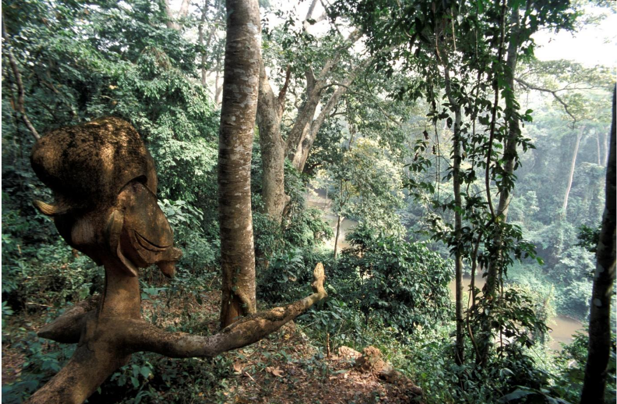
Fig. 2, La forêt sacrée d'Osun Osogbo, Nigéria.

Au-delà du succès de ces projets situés , suivant le principe adopté par le programme Africa 2009 d'allers-retours entre les projets situés et le projet cadre , toutes ces nouvelles expériences continuèrent d'alimenter et d'enrichir les contenus des programmes de formation. Outre une large part du cours annuel (3 mois) portant sur l'élaboration d'un plan de gestion pour un site support – dont certains furent utilisés par la suite pour des propositions d'inscription 12 –, un cours technique fut organisé au Rwanda du 2 au 27 juillet 2007, portant spécifiquement sur l'élaboration des propositions d'inscription de biens culturels sur la Liste du patrimoine mondial.