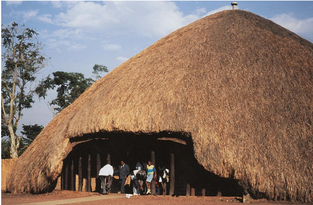
Fig. 1, Tombes des rois du Buganda à Kasubi, Ouganda, édifice principal, Photo : S. Moriset

Joffroy et Sébastien Moriset de CRAterre ainsi que Joseph King de l'ICCROM qui purent ainsi vérifier en conditions réelles la validité des méthodologies d'approche participatives pour la définition et la qualification de biens culturels complexes 6 et surtout explorer les possibilités de concilier de façon pertinente les avantages et inconvénients respectifs des systèmes de gestion institutionnels « classiques » et « coutumiers ».