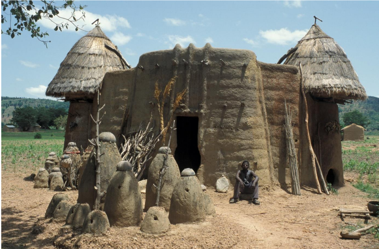
Fig. 3, Le Koutammakou, un paysage culturel unique au Togo

La structure, les méthodes pédagogiques et les contenus de ce cours furent par la suite repris dans le cadre de l'initiative continentale devant prendre le relais d' Africa 2009 , le Fonds pour le Patrimoine Mondial Africain (AWHF), lancé en 2006. Ainsi, outre quelques Assistances préparatoires individuelles qui sont attribuées aux états parties africains de la convention de 1972, depuis 2008 AWHF organise des cours entièrement dédiés à la question de l'élaboration de dossiers de nomination, à l'instar du programme Africa 2009 , alternativement en français et en anglais.