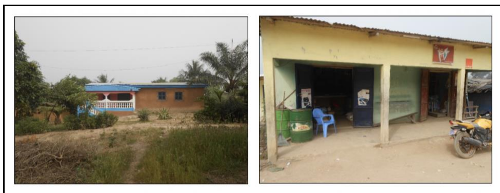
Figure 3 : Habitat et Magasins réalisés par des acteurs informels

Les personnes qui exercent dans le service payent 2000 francs cfa /mois, tandis que ceux de la production, de l'échange et de l'art, s'acquittent d'une somme de 1 500 francs cfa /mois car ces activités sont de tailles plus réduites. En plus de contribuer au développement de l'économie locale, certains acteurs investissent dans la construction d'habitats modernes ou de locaux qu'ils mettent en location. Un propriétaire de maquis et restaurant enquêté au quartier Antenne révélait avoir construit en 7 ans son habitat (figure 3a). Quant au mécanicien interrogé au quartier Commerce, il déclare avoir réalisé ses magasins en 3 ans (figure 3b).