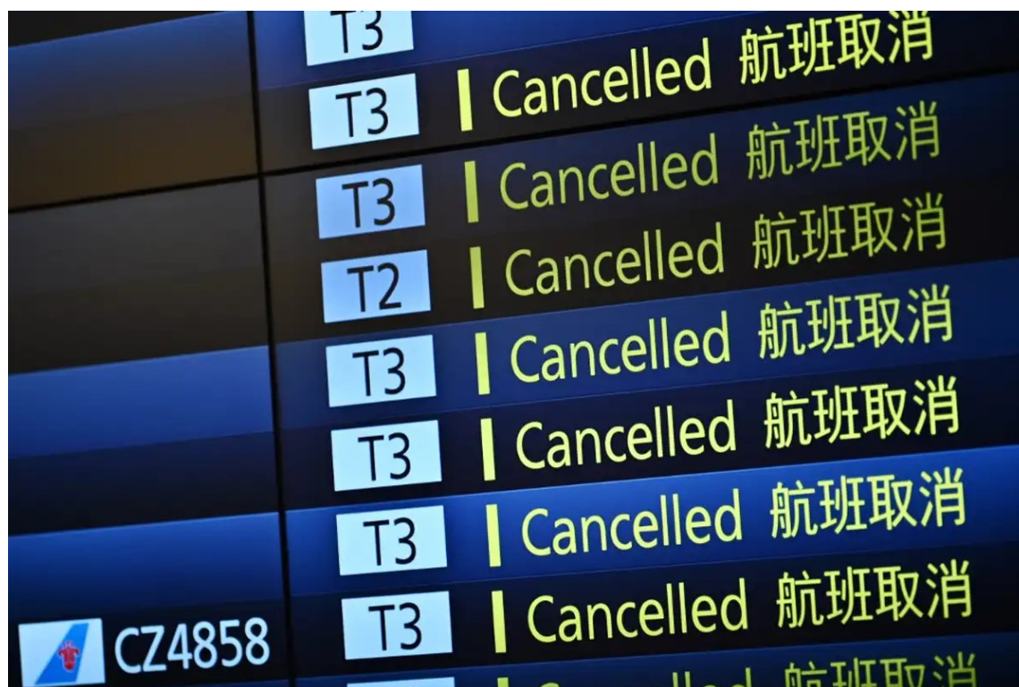
Un panneau indique les vols annulés au terminal international de l'aéroport de Haneda à Tokyo, le 3 avril 2020.

Or les principes et les informations scientifiques disponibles ne justifient pas les restrictions du trafic international. De plus, la plupart des pays n'ont pas notifié à l'OMS les raisons de santé publique qui ont motivé leur décision. Les chercheurs enjoignent les gouvernements de suivre plutôt les recommandations de l'OMS en augmentant le nombre de tests et en s'assurant que la distanciation sociale est respectée.