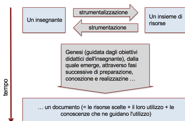
Figura 1. Rappresentazione della genesi documentale

L'ADD propone un modello di interazione tra insegnanti e risorse, che ha implicazioni per la formazione professionale degli insegnanti. Sebbene in Internet siano disponibili molti materiali potenzialmente adatti alla classe, non viene allo stesso tempo fornito un sostegno adeguato per effettuare la ricerca e la selezione di materiali pertinenti. Questo però diventa necessario nel momento in cui si cercano risorse particolari (anche interattive) da combinare con altre risorse (per esempio, il libro di testo), tenendo conto delle rispettive caratteristiche epistemiche o didattiche. In altre parole, ciò che è fornito agli insegnanti è spesso "un insieme di mattoncini", senza ulteriori indicazioni su come questi mattoncini potrebbero essere messi insieme per sviluppare una coerente traiettoria di apprendimento per gli studenti. Sia che cerchino esercizi per integrare un determinato argomento, sia che pianifichino percorsi di apprendimento attraverso il ricorso a un e-book, gli insegnanti avranno bisogno di un sostegno professionale per sviluppare la loro capacità progettuale (Pepin, Gueudet e Trouche 2017), cioè la consapevolezza e la sensibilità agli aspetti matematici e pedagogici delle risorse, e la flessibilità nell'usarle (cfr. Box 1). Questa capacità progettuale degli insegnanti è considerata da Wang (2018) come parte della loro competenza documentale .