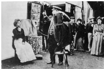
Photographe ambulant dans une foire, vers 1900

Pour que la pratique de la photographie commence à se répandre dans la population, il fallut, une fois de plus, de nouvelles innovations techniques. Entre 1871 et 1878, fut mise au point une nouvelle émulsion photosensible beaucoup plus réactive à la lumière, le gélatino-bromure d'argent, qui autorisa des temps de pose de 1/25 e me de seconde. Puis on inventa, en 1889, un film négatif souple qui permit enfin de s'affranchir des plaques de verre. A partir de là, apparurent les premiers appareils portables que la firme américaine Eastman systématisa sous le nom de Kodak. Les premiers modèles devaient être retournés à l'usine pour traitement du film ; le client recevait ensuite les tirages avec un nouvel appareil rechargé (la vogue beaucoup plus récente des appareils jetables n'a fait que reprendre la même formule). D'où le fameux slogan : « Appuyez sur le bouton, nous faisons le reste ».