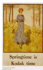
Publicité Kodak, vers 1910

Popular Photography , magazine américain destiné aux photographes amateurs, fut lancé en 1913.