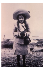
Image pour une publicité Kodak

Par la suite, on pouvait se contenter de donner le film à développer tout en conservant l'appareil. Facilité d'utilisation, vitesse de prise de vue et modicité du coût de ces nouveaux appareils, tous ces facteurs permirent le développement de la pratique photographique en dehors des sphères professionnelles. Significativement, les premières publicités de Kodak étaient axées sur les femmes et les enfants pour montrer que la photographie était devenue un jeu d'enfant.