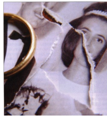
Photo de mariage déchirée

Il ressort de cette brève description que la pratique de la photographie est devenue partie intégrante de la vie quotidienne des gens, et même une part constitutive de la vie de famille (pour deux jalons de cette évolution, voir Bourdieu, 1965, et Mormiche, 1989). Produire des images sur les siens accompagne aujourd'hui pour ainsi dire naturellement la réalité vécue avec eux. Les doubler en images contribue à renforcer les liens qui nous unissent à eux. Toute famille se met ainsi en scène en images à mesure qu'elle se constitue.