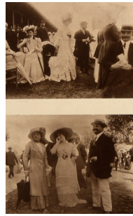
Mondanités à Trouville, 1903