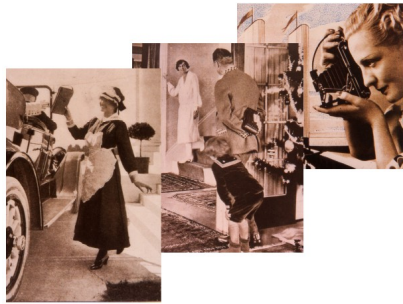
Publicités Kodak, début du XX e siècle

A cet égard, l'amateurisme de cette fin de siècle se distinguait aussi nettement de l'affairisme que de la démocratisation de la photographie. C'est parmi ces amateurs d'élite que se recrutèrent certains des photographes les plus soucieux de faire de la photographie un art reconnu et rien d'autre qu'un art.