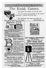
L'une des premières publicités Kodak

Par la suite, on pouvait se contenter de donner le film à développer tout en conservant l'appareil. Facilité d'utilisation, vitesse de prise de vue et modicité du coût de ces nouveaux appareils, tous ces facteurs permirent le développement de la pratique photographique en dehors des sphères professionnelles. Significativement, les premières publicités de Kodak étaient axées sur les femmes et les enfants pour montrer que la photographie était devenue un jeu d'enfant.