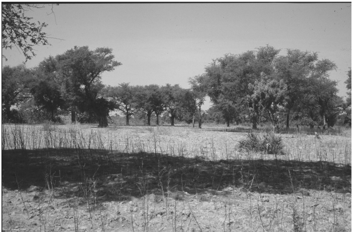
Photo 1 : Plants de coton sous un parc arboré à Faidherbia albida (Nord Cameroun, Janvier 1998)

Il ne s'agit pas d'un verger planté, mais du résultat d'une sélection réalisée par l'homme parmi les essences en place, complétée éventuellement par des semis, plants ou boutures. Les parcs sont formés d'une ou plusieurs espèces, l'une dominante, les autres secondaires ou « accompagnatrices ». (Photo 1) La densité des arbres et leur espèce sont extrêmement variables dans le temps et dans l'espace comme nous le verrons par la suite.