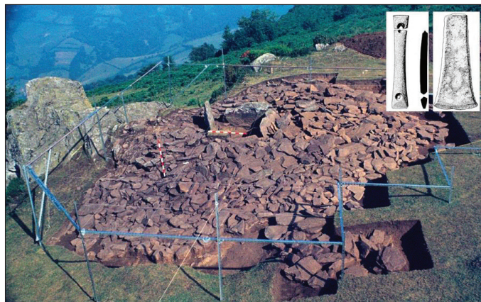
Fig. 3. Mégalithe de Los Fitos, Quirós (Asturies) (Ex. M.Á. de Blas).