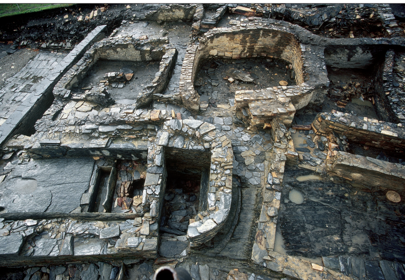
Fig. 4. Sauna rituel du Chao Samartín, bâtiment intégré dans le paysage urbain du village (Ex. Á. Villa Valdés).

La Acropole du Chao Samartín semble répondre à la volonté de s'approprier un lieu symboliquement important pour les communautés environnantes. Pour cela ont été appliquées solutions constructives pour qui, au-delà de l'établissement d'une limite physique reconnaissable et militairement efficace, une monumentalisation et une visibilité évidentes ont été recherchées. Par conséquent, un scénario approprié pour renforcer les mécanismes de pouvoir et de cohésion politique de la communauté.