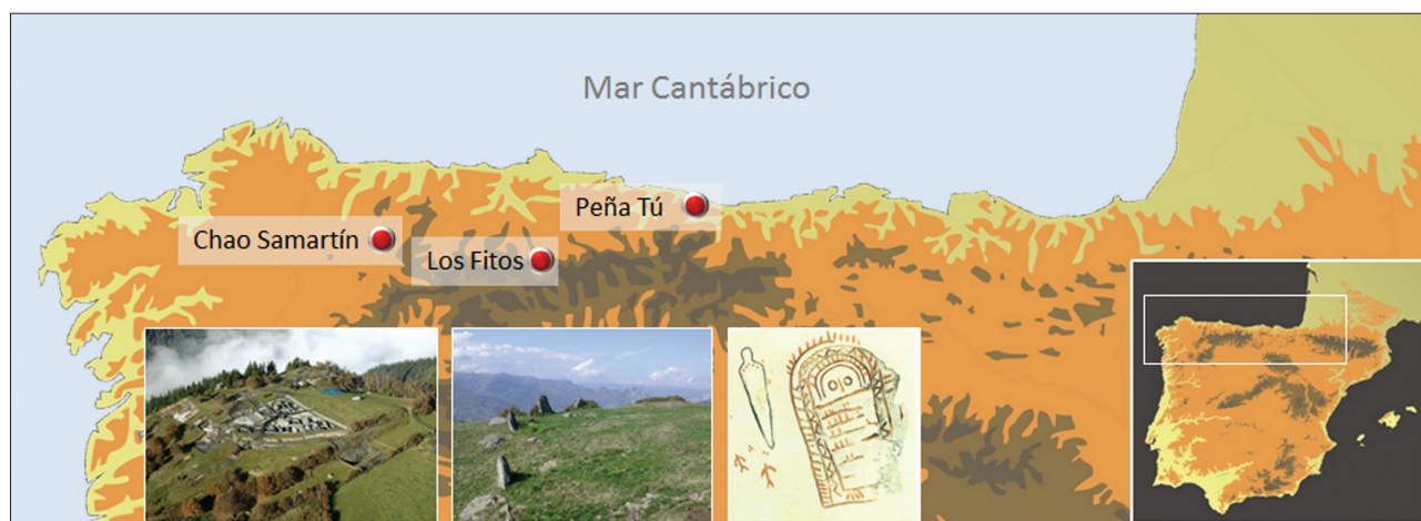
Fig. 1. Sites mentionnés dans le texte (dessin Á. Villa Valdés).

Donc n'est pas surprenante l'identification des « pierres sacrées » dont l'établissement fourchette de l'âge du Bronze