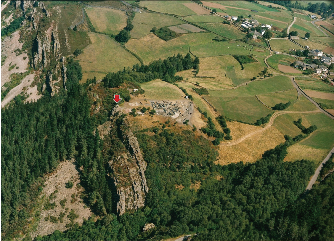
Fig. 5. Castro de Chao Samartín, Grandas de Salime (Asturias). La flèche pointe vers la position de la roche (Ex. Á. Villa Valdés).