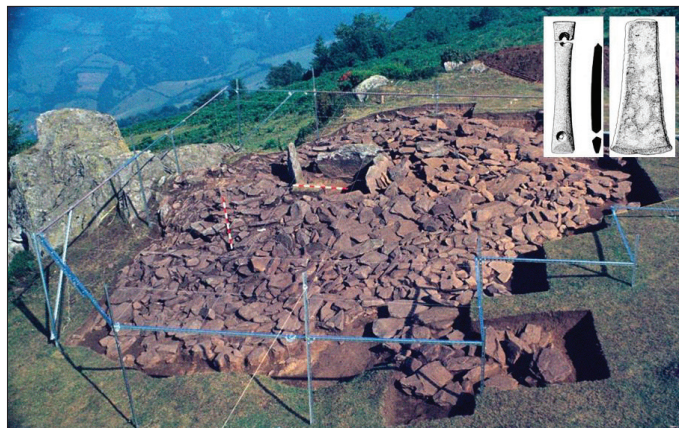
Fig. 3. Mégalithe de Los Fitos, Quirós (Asturies) (Ex. M.Á. de Blas).