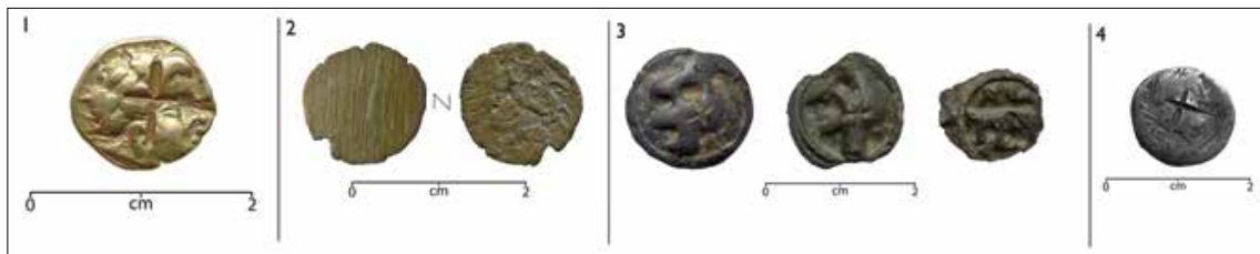
Fig. 2. Monnaies découvertes à Panzoult « La Grange-aux-Moines ». 1. Droit d'un quart de statère à la lyre renversée ; 2. Quart de statère limé ; 3. Potins à la tête diabolique marqués d'une croix au droit et au revers ; 4. Quinaire de Rubria buriné sur son droit.

En ce qui concerne les pratiques observées, en plus des habituels jets ou dépôts, la mutilation des pièces est très présente notamment sur les potins. Cette singulière pratique, observée ailleurs en Gaule et au-delà (Fig. 1), semble malgré tout plus systématique dans les sanctuaires turons (3 des 5 connus) entre les années 40/30 av. et 20 apr. J.-C. Elle consiste à frapper au burin ou au ciseau, voire à limer une face de la monnaie pour lui enlever toute valeur d'échange. Le cas turon est l'occasion de faire un point sur cette pratique particulière au sein des sanctuaires communautaires.