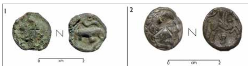
Fig. 4. Monnaies découvertes à Amboise « Les Châtelliers », rue Rouget de L'Isle. 1. Potin à la tête diabolique marqué au droit ; 2. Drachme pictonne marquée au droit.

La mutilation des monnaies en contexte culturel au tournant de notre ère semble courante chez les Turons mais rien n'indique que cette pratique ait perduré.