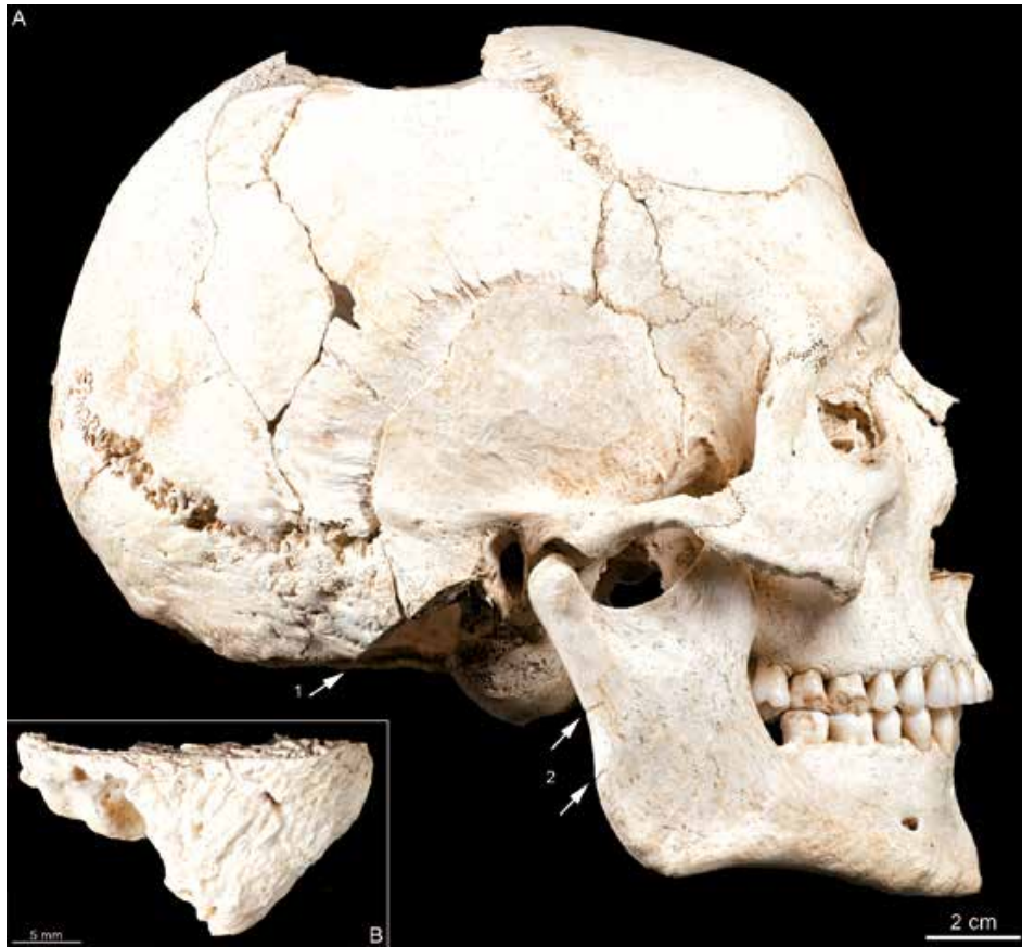
Fig. 5. Tête complète B7a avec sa mastoïde tranchée. A. Vue latérale droite (1. Section du processus ; 2. Entailles sur la branche droite de la mandibule) ; B. Portion détaché du processus (vue postérieure).