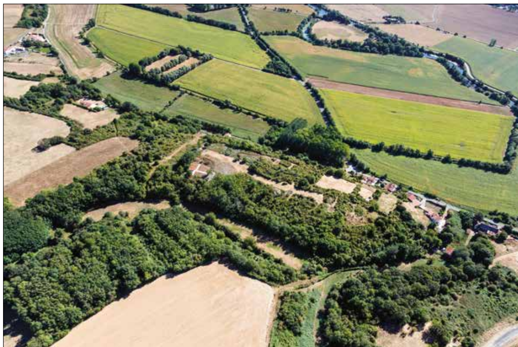
Fig. 1. Vue aérienne du site des Châtelliers du Vieil-Auzay qui domine la large vallée alluviale de la Vendée.

C'est au cours de l'intervention archéologique débutée en 1978 qu'a été découverte, sous le rempart, une diaclase surcreusée scellée par un important comblement de près de 5 m de puissance. Ce comblement, complexe, comprenait des niveaux datés du Néolithique moyen jusqu'à l'époque médiévale, et c'est dans une couche intermédiaire mal perçue à l'époque qu'ont été mis au jour plusieurs vestiges humains, dont un crâne complet,