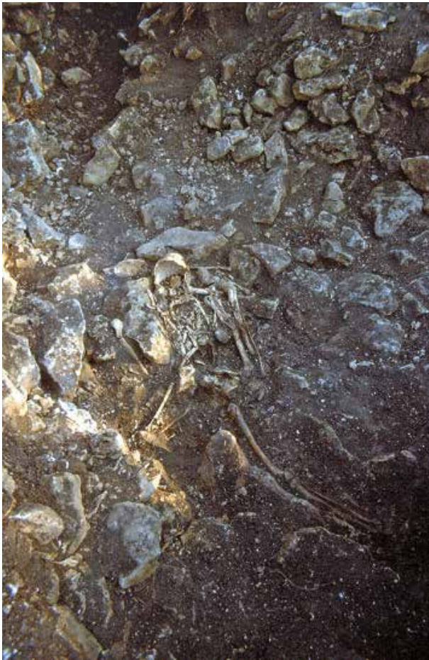
Fig. 4. Squelette complet présent dans le comblement supérieur d'une grande fosse (couche 5).