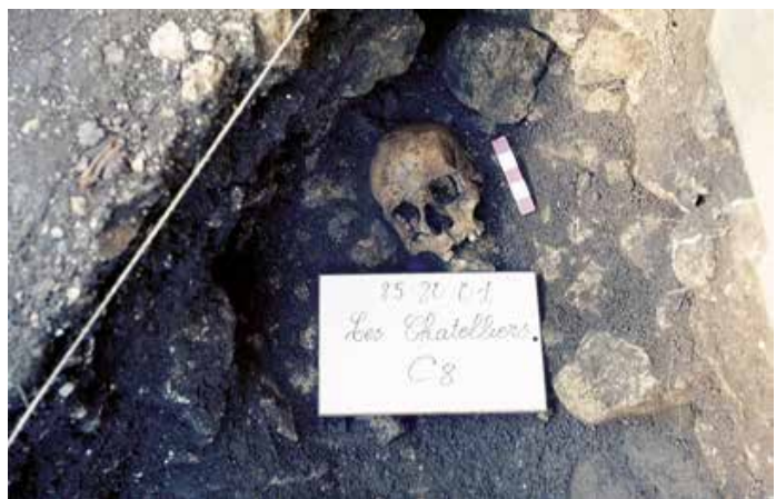
Fig. 2. Crâne complet (A) et « masque facial » (B) présents dans un niveau de comblement de la diaclase.