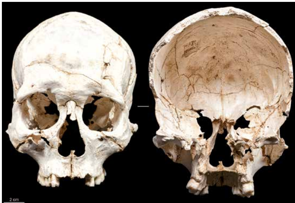
Fig. 6. « Masque facial » C8 : vues antérieure et postérieure.