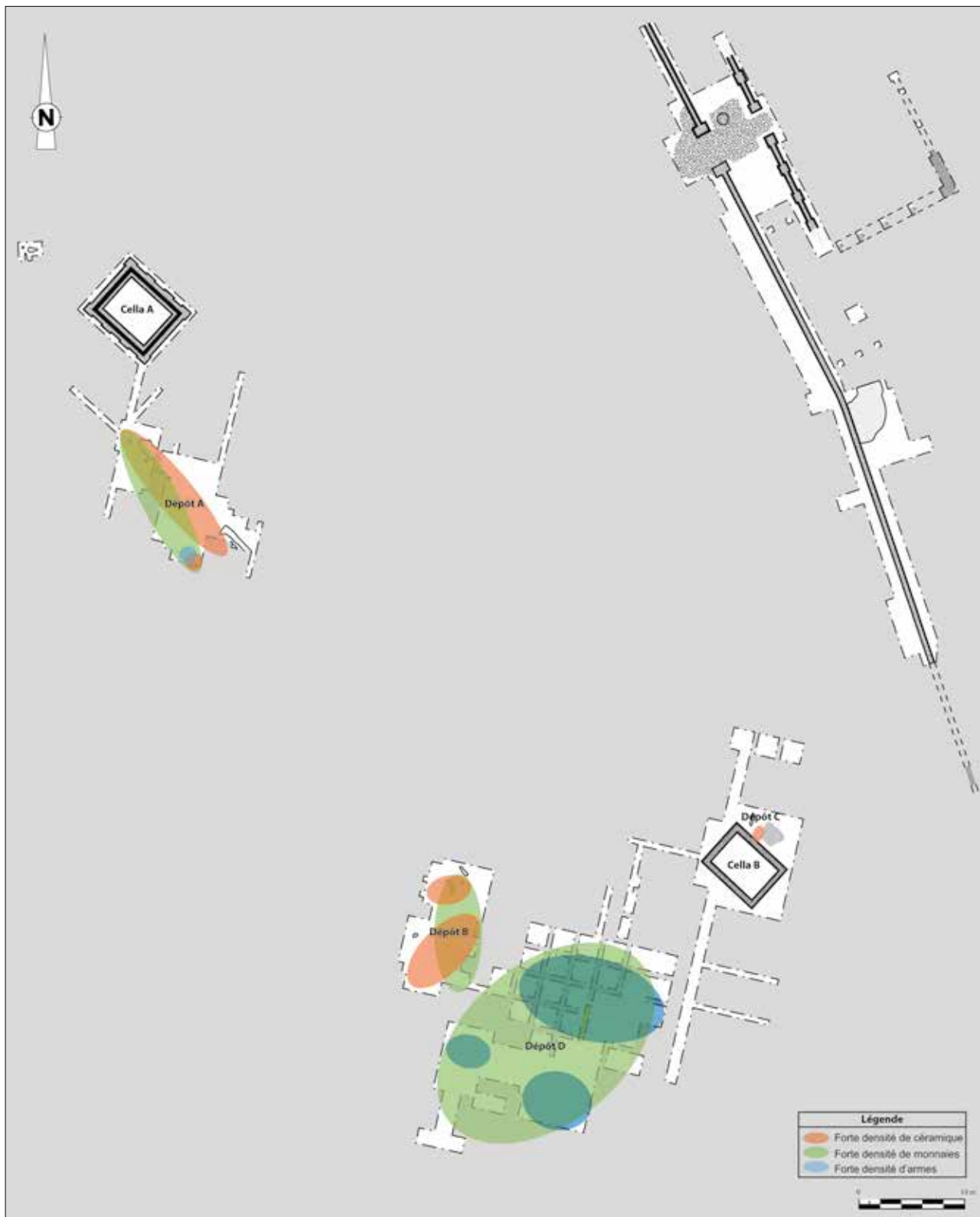
Fig. 1. Plan du sanctuaire de Baâlons-Bouvellemont (dessin B. Squevin, DAO M. Pieters).

« dénominateurs communs les plus évidents » des dépôts rituels celtiques (Kaurin et al. 2015, p. 17).