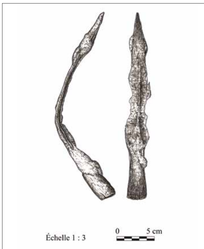
Fig. 3. Fer de lance réel plié (dessin B. Squevin).