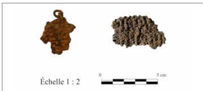
Fig. 4. Fragments de cottes de mailles découpés.