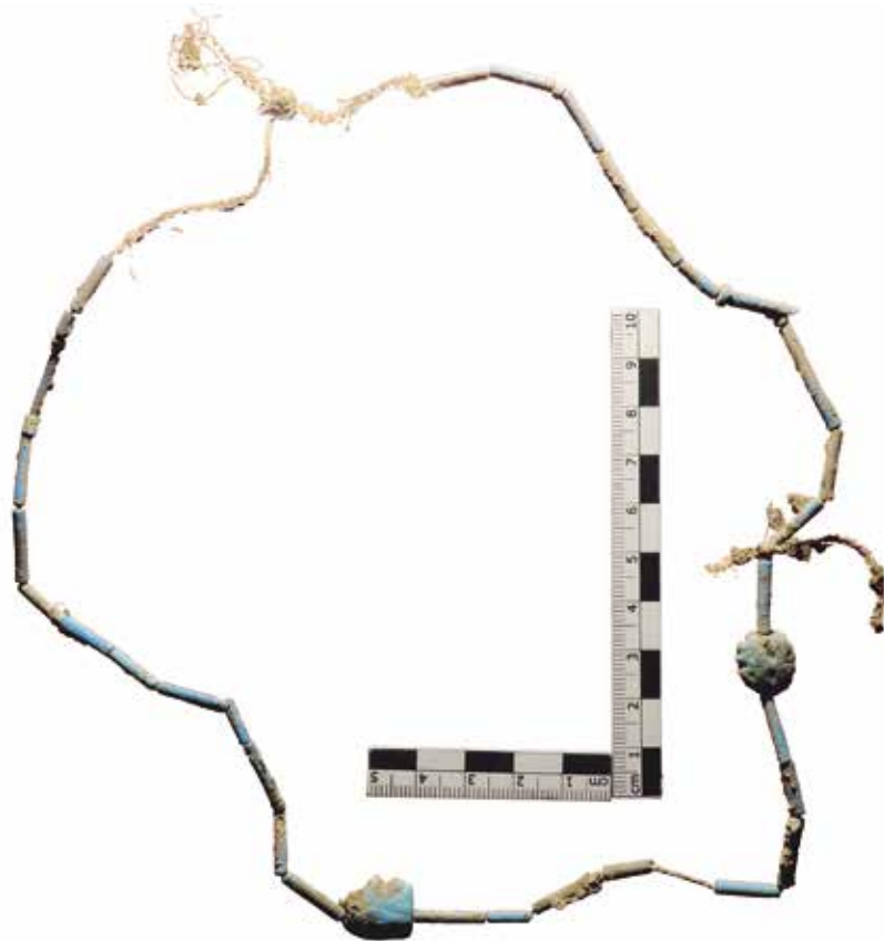
Fig. 4. Collier de perles en faïence provenant du sondage B.