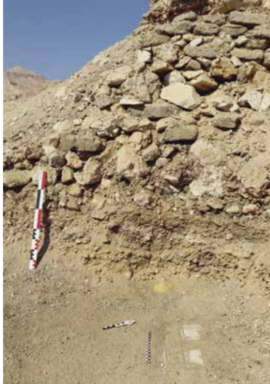
Fig. 3. Sarcophage à fond blanc noyé dans un terrassement.