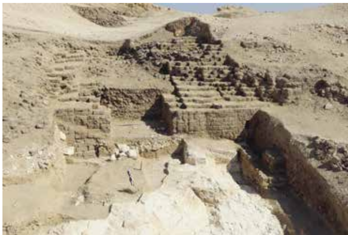
Fig. 1. Sondage B en cours de fouille.

Chacun des sondages a produit des données prometteuses pour l'histoire du site antérieure à la construction de la TT 33. Dans l'espace du sondage B (fig. 1), des cavités orthogonales creusées dans le calcaire de Tarawan ont révélé une phase ancienne de l'aménagement du site. La fouille prochaine du remplissage de ces excavations devra déterminer si elles appartiennent à des tombes, à une carrière de blocs ou à une combinaison de ces structures, car le